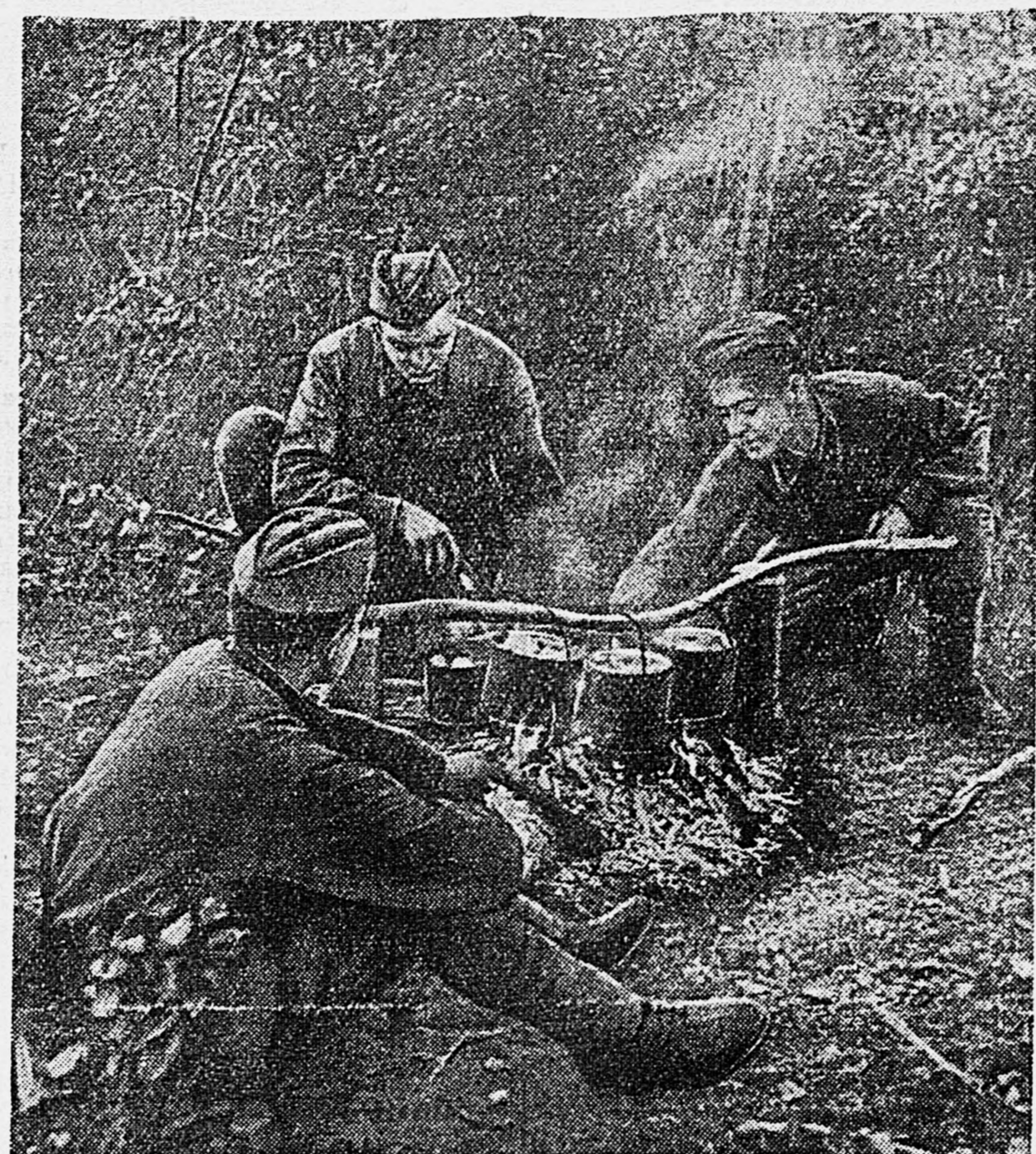
ЗАПАДНЫЙ ФРОНТ. Бойцы готовят обед.

Привлекать подобным фактом, полковник призвал агитаторов большинства словом и делом воздействовать на массы бойцов, чтобы они ни на минуту не оставляли врага в покое, постоянно искали истребляли живую силу и технику противника.