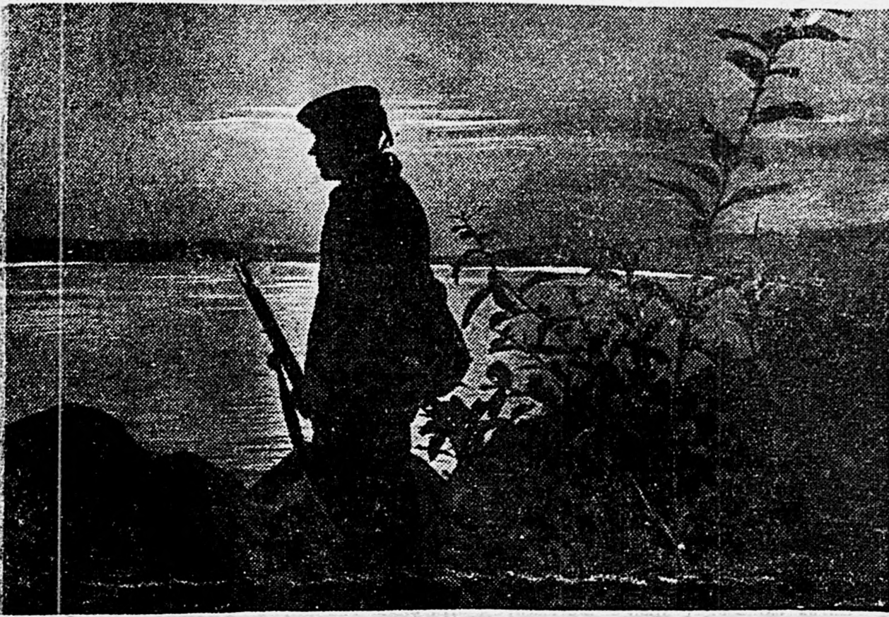
ЛЕНИНГРАДСКИЙ ФРОНТ. На снимках: 1. Ночью на посту. 2. Засада у реки.