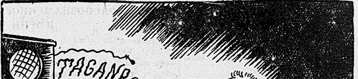
НЕВАЖНОЕ сообщение в Берлине.