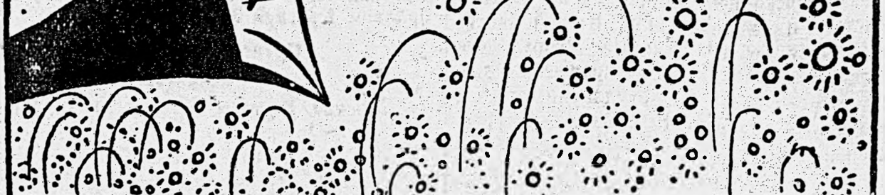
ВАЖНОЕ СООБЩЕНИЕ в Москве.