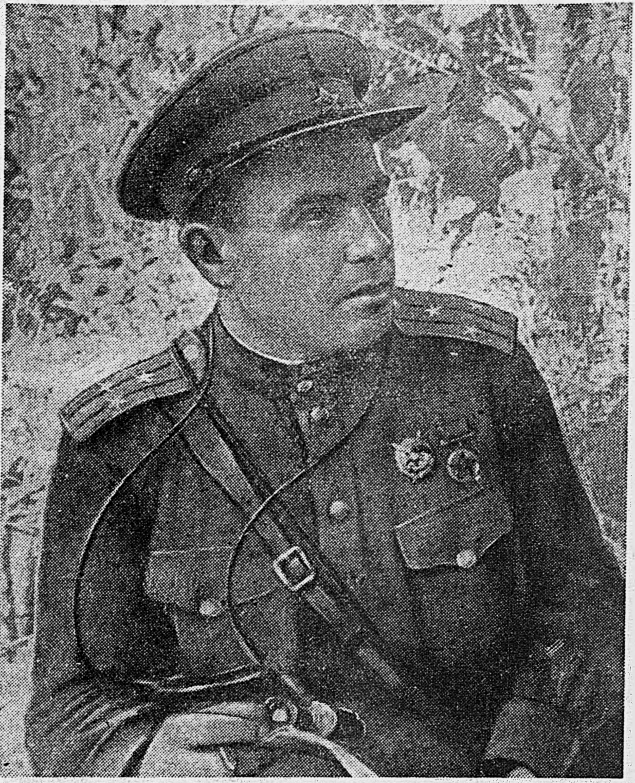
Командир 375 Харьковской стрелковой дивизии полковник П. Д. Говоруненко. Указом Президиума Верховного Совета СССР от 27 августа 1943 г. он награжден орденом Суворова 2-й степени.

В свою очередь наша авиация, взаимодействуя с наземными войсками, наносит мощные удары с воздуха по скоплениям противника. Успешно выполняли боевое задание две девятки пикирующих бомбардировщиков, которыми командовали капитаны Палий и Вишняков. Они сбросили бомбовый груз на скопление вражеских танков и автомашин. Уходя от цели, летчики сбросили несколько оцгов топлива. Группы самолетов «Як-9» и «Ил-2», ведомые гвардии капитаном Безугловым и гвардии лейтенантом Степановым, сбросили пять заходов на штурмовку огневых позиций вражеской артиллерии и минометов, уничтожив цели.