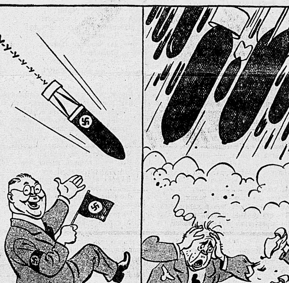
РАНЬШЕ: воюющие бомбы от немцев.