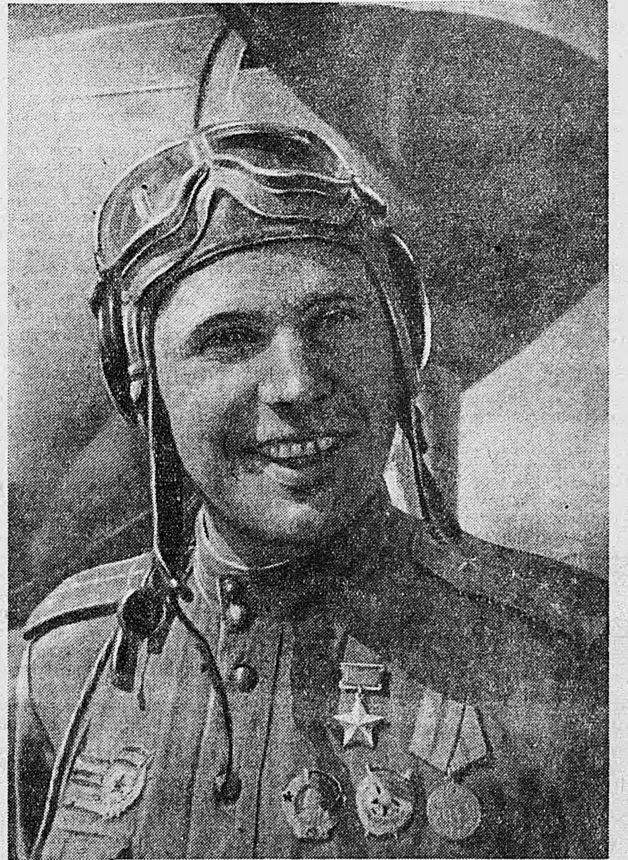
Герой Советского Союза летчик-истребитель Г. Кузьмин, сбивший 21 немецкий самолет.

Деревня Батамы, Знаменского района, 26 августа. (Спецкорр. ТАСС).