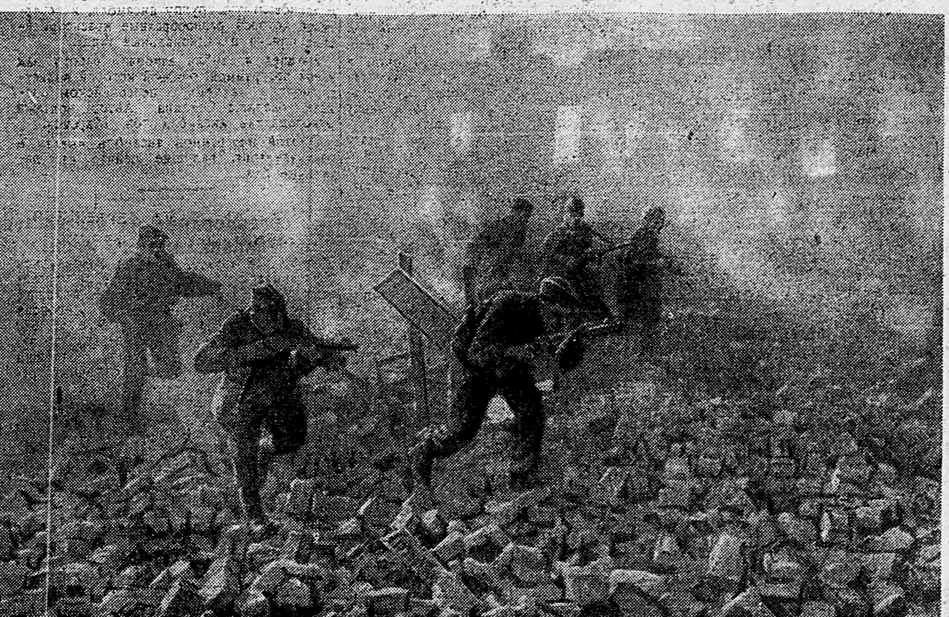
БРЯНСКОЕ НАПРАВЛЕНИЕ. Автоматчики ведут бой за населенный пункт.

Не в лицу редакции красноармейской газеты эта пустая шумиха по поводу собственных «заслуг!»