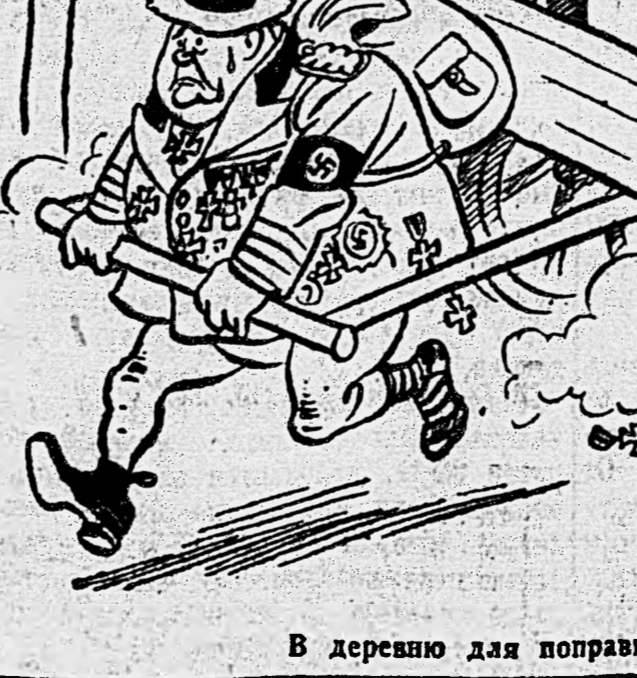
В деревню для поправки здоровья...