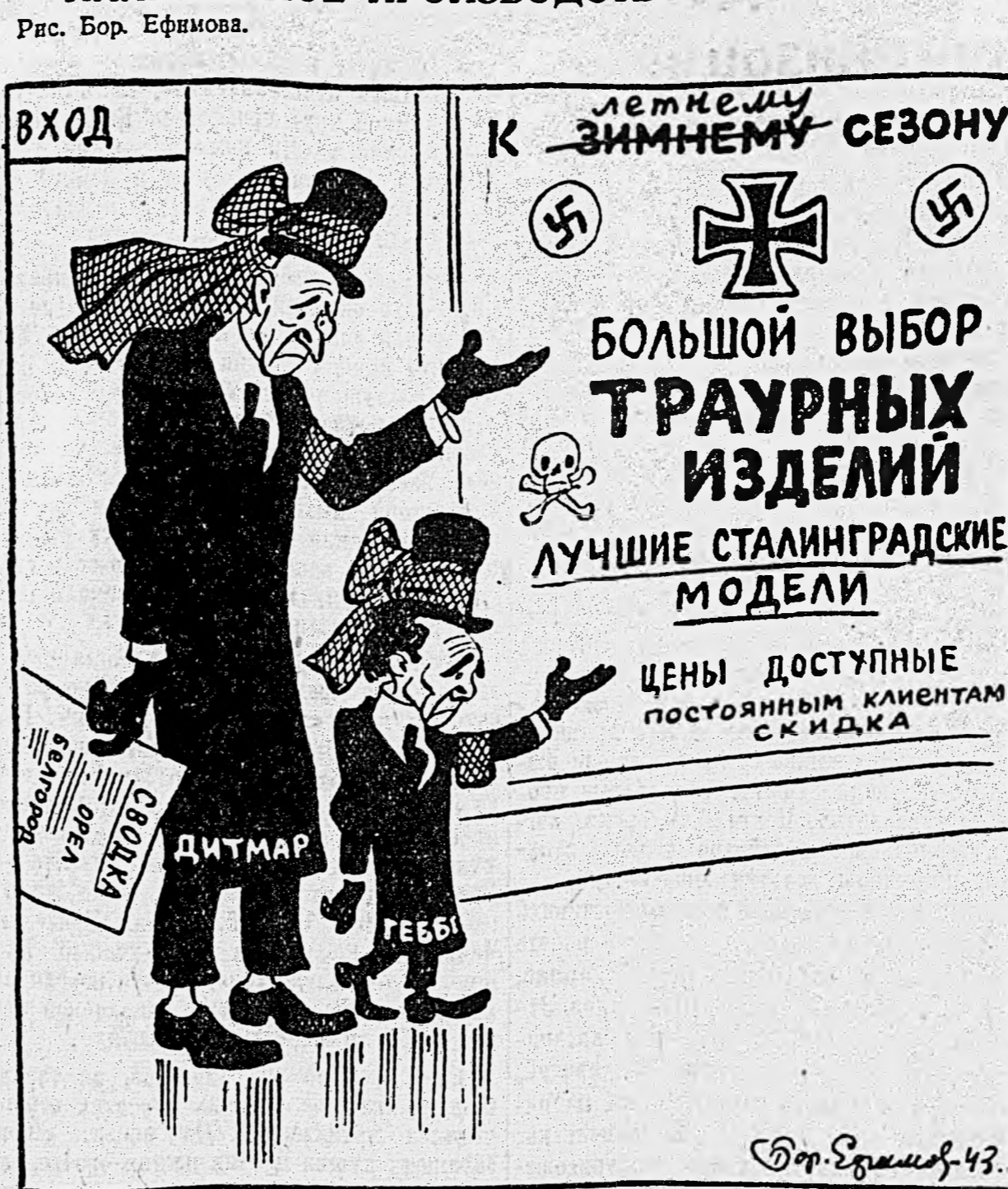
Комбинат гробового обслуживания (функционирует зимой и летом).