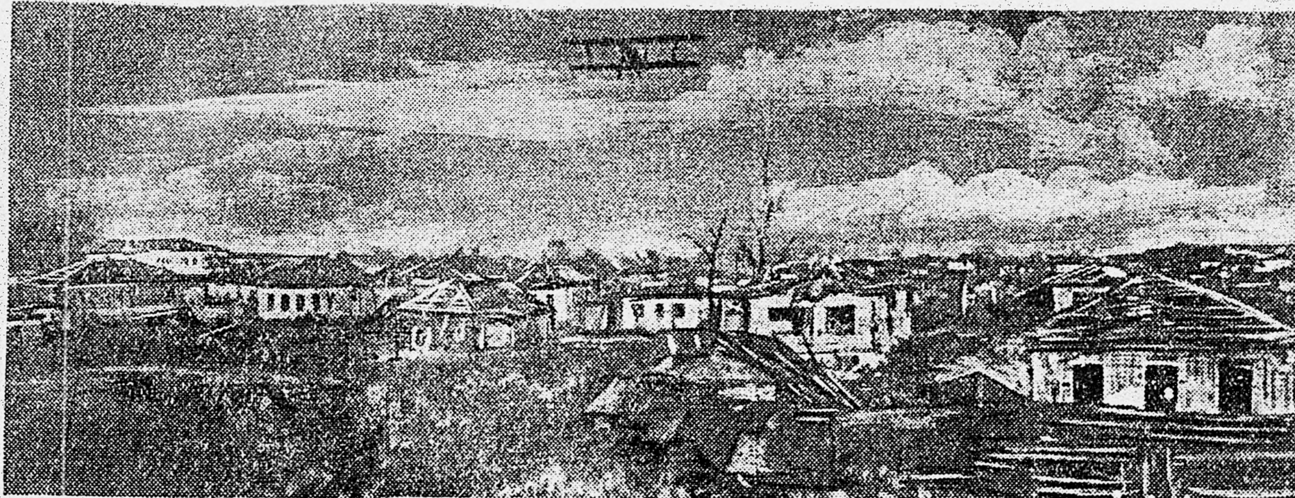
БЕЛГОРОД. 1. Один из районов города, превращенный немцами в развалины. 2. Здание вокзала, разрушенное фашистами при отступлении. 3. Объявление немецкой коммандуры, которыми пестрели улицы города. Снимки нашего спец. фотокора, О. Кнорринга. Доставлены на самолете летчиком лейтенантом А. Захаровым.