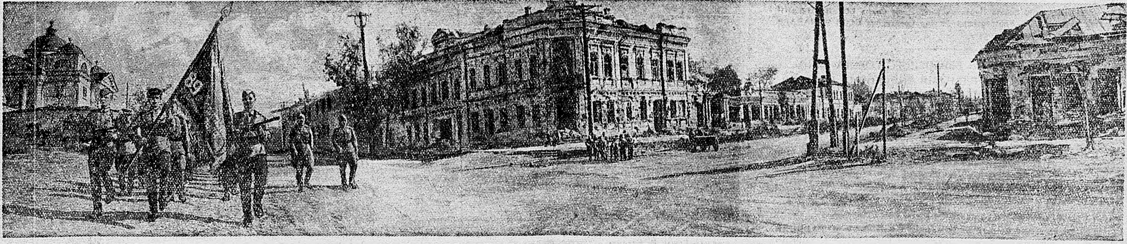
БЕЛГОРОД. Части 89 Гвардейской Белгородской стрелковой дивизии под развернутым знаменем проходят по улицам освобожденного ими города.