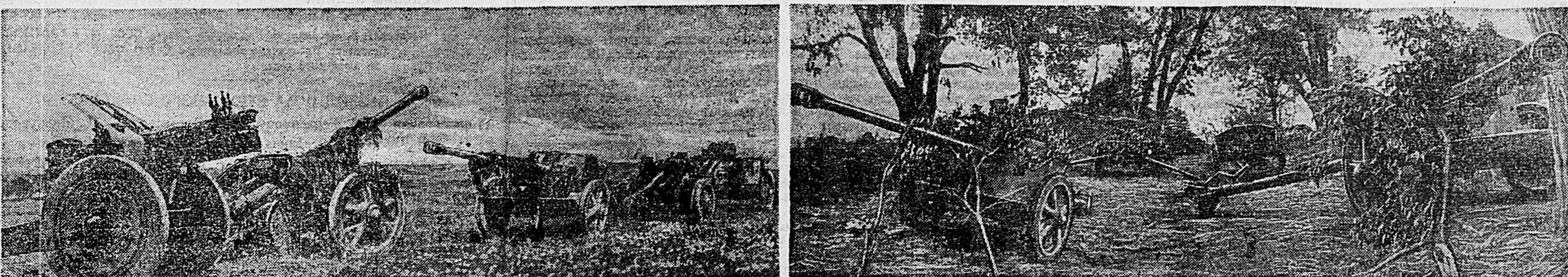
ДЕЙСТВУЮЩАЯ АРМИЯ. Слева — немецкие орудия, захваченные нашими частями севернее Орла. Справа — противотанковые и тяжелые орудия, подбитые частями Красной Армии в районе юго-западнее Ворошиловграда. Снимки наших след, фоторок. майора С. Лоскутова и капитана В. Темина (доставлены на самолетах летчиками лейтенантом А. Захаровым и лейтенантом З. Коваленко).