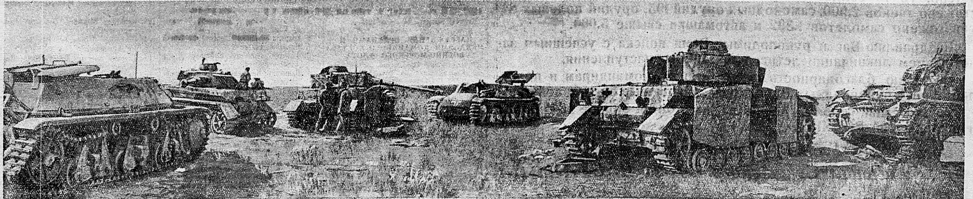
ОРЛОВСКОЕ НАПРАВЛЕНИЕ. Подбитые нашими частями немецкие танки в районе населенного пункта Хатьково.