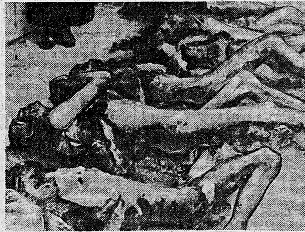
ЗВЕРСТВА НЕМЕЦКО-ФАШИСТСКИХ ЗАХВАТЧИКОВ И ИХ ПОСОБНИКОВ НА ТЕРРИТОРИИ г. КРАСНОДАРА И КРАСНОДАРСКОГО КРАЯ. На снимке: слева здание гестапо в г. Краснодаре, которое гитлеровцы перед своим бегством из города подожгли, предварительно заминировав его. При поджоге здания в нем мучительной смертью погубило около 300 арестованных советских граждан. Справа — обгоревшие трупы советских граждан.