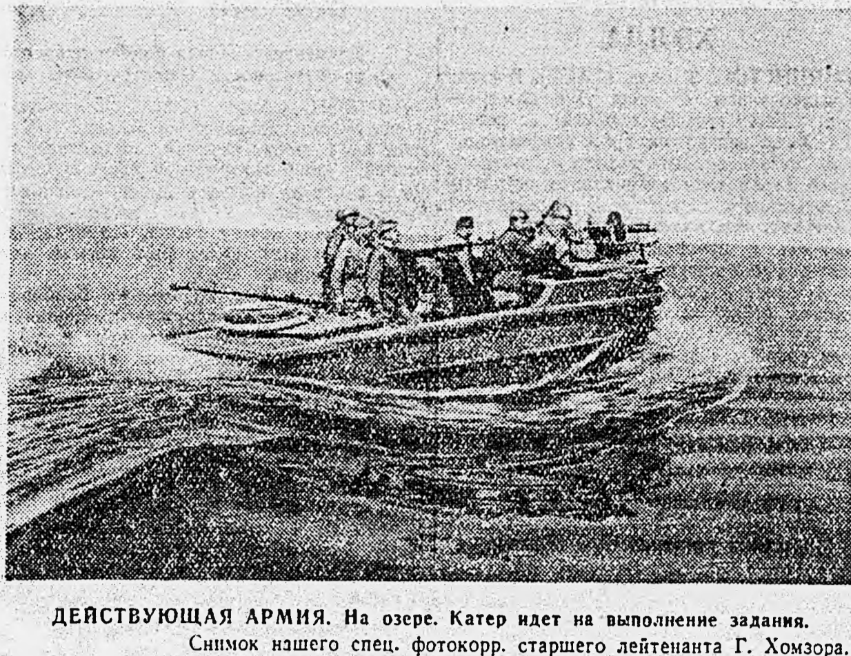
ДЕЙСТВУЮЩАЯ АРМИЯ. На озере. Катер идет на выполнение задания.

А. СУРКОВ Безымянная Ну, как я забуду, добрая, ласковая, То хмурое утро декабрьского дня. Когда, обреченной смерти вытаскивая, Ты телом своим прикрывала меня. Полага ты по снегу, железом Иссеченному, постоянно я В окопе, в землянке, в лесной шалаше. В то хмурое утро, моя безымянная, Ты солнечный луч обронила в душе.