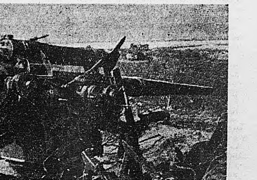
КАЛИНИНСКИЙ ФРОНТ. Немецкие орудия, захваченные нашими войсками в районе города Ржев.