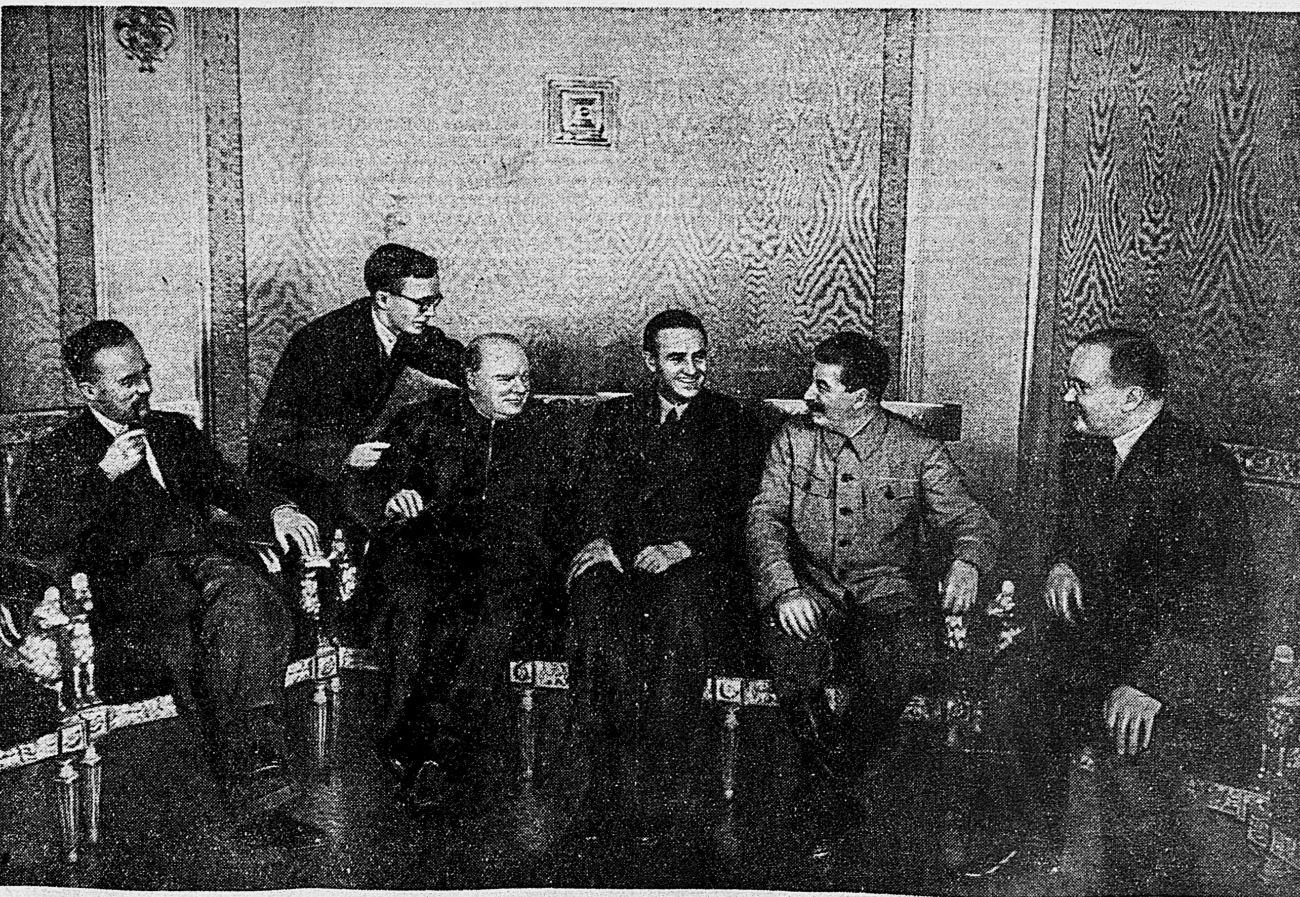
К пребыванию в Москве Премьер-Министра Великобритании г-на У. Черчилля и представителя Президента Соединенных Штатов Америки г-на Гарримана. На снимке слева направо: постоянный заместитель Министра Иностранных Дел Великобритании сэр Александр Кадоган, В. Н. Павлов, г-н У. Черчилль, г-н Гарриман, И. В. Сталин, В. М. Молотов.

Председатель Президиума Верховного Совета СССР М. КАЛИНИН, Секретарь Президиума Верховного Совета СССР А. ГОРКИН. Москва, Кремль, 16 августа 1942 г.