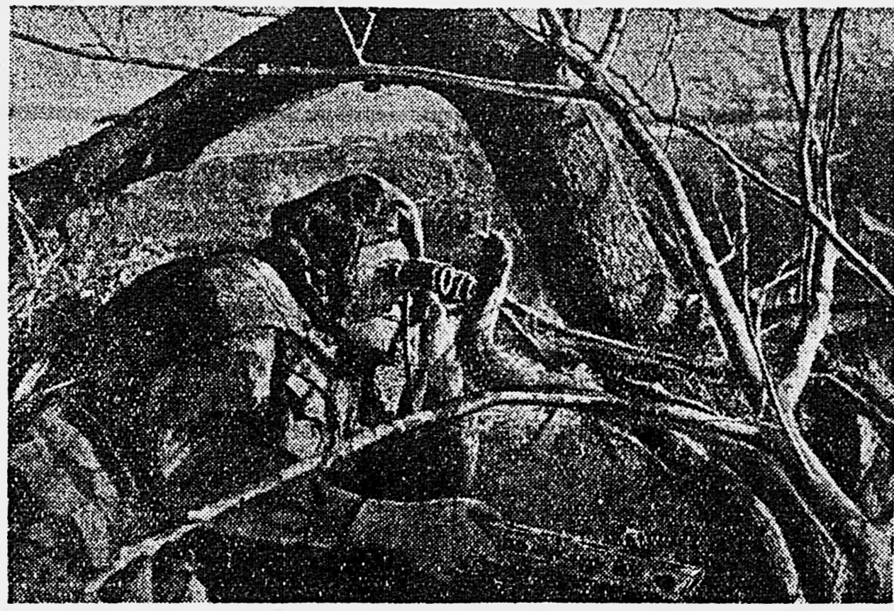
НА ДОНУ. В разведке.

В этом примере помимо большой личной инициативы комбат показал умение непереворачивать на поле боя, что, к сожалению, не всегда удается. На другом участке фронта часть, которой командовал майор Баранов, вела наступление. На небольшом плацдарме командир развернул все свои силы в то время, как при ударе немцы могли бы достигнуть успеха, выведя в бой лишь треть этих сил. Бросив на поле