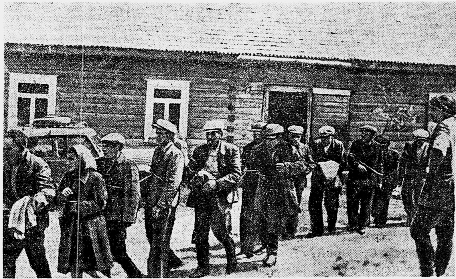
Ни в чем неповинных советских людей немцы изверги связывают веревками и гонят, как скот, на фашистскую каторгу, на убой, на смерть.

Эти снимки найдены у убитых немецких солдат и офицеров. Немцы ходят не только с автоматами, но и с фотоаппаратами. Палачам мало того, что они расстреливают и вешают мирных советских людей, вырывают языки и вырезают звезды на спинах пленных красноармейцев. Они еще фотографируют свои «подвиги». Они хотят глумиться над своими жертвами и после их смерти. Они хотят хвастаться у себя дома перед Мартами и Гертрудами своими кровавыми делами.