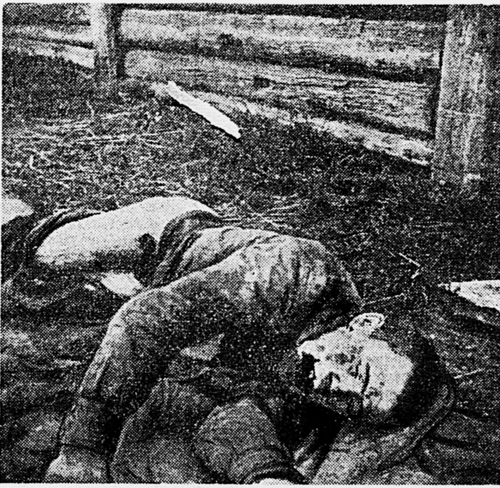
Вот растерзанный пленный советский боец. Фашисты вырвали у него язык, выкололи глаза, отрезали половой орган.