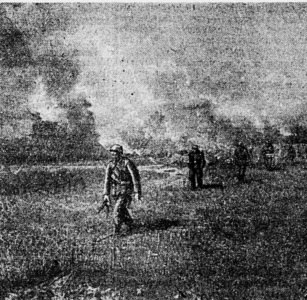
Фашисты превращают все вокруг в «зону пустыни». Вот идут эти бандиты, поджигаящие наши города и села.