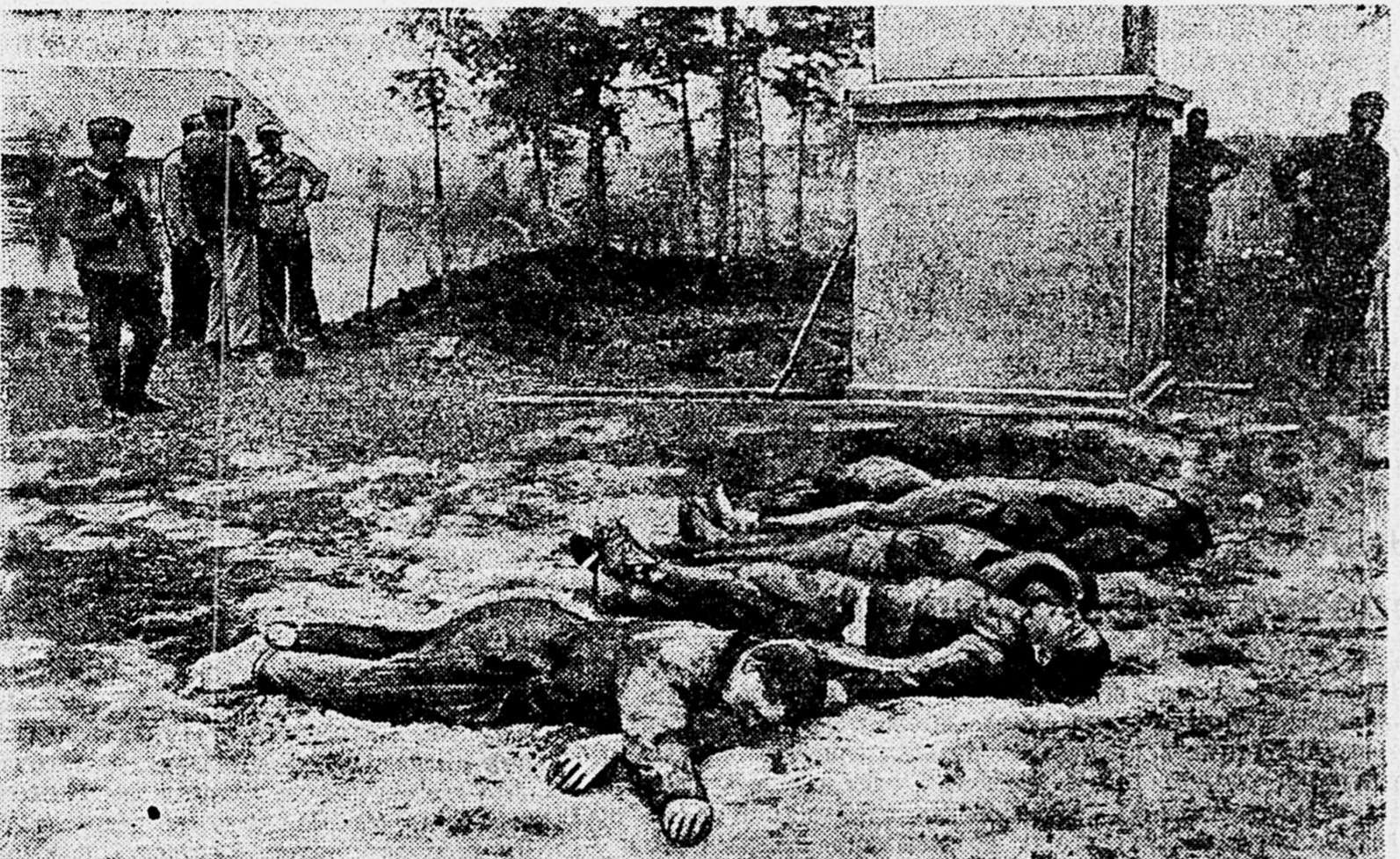
Немцы долго пытали этих пленных советских бойцов. Затем привели их на окраину селения и здесь расстреляли. Кровь наших братьев вытекает о мести, беспощадно мести врагу!