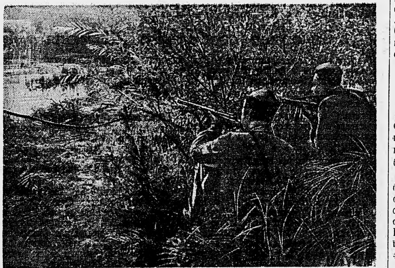
В РАЙОНЕ ЦЫМЛЯНСКОЙ. Автоматчики на обороне берега реки Дон.