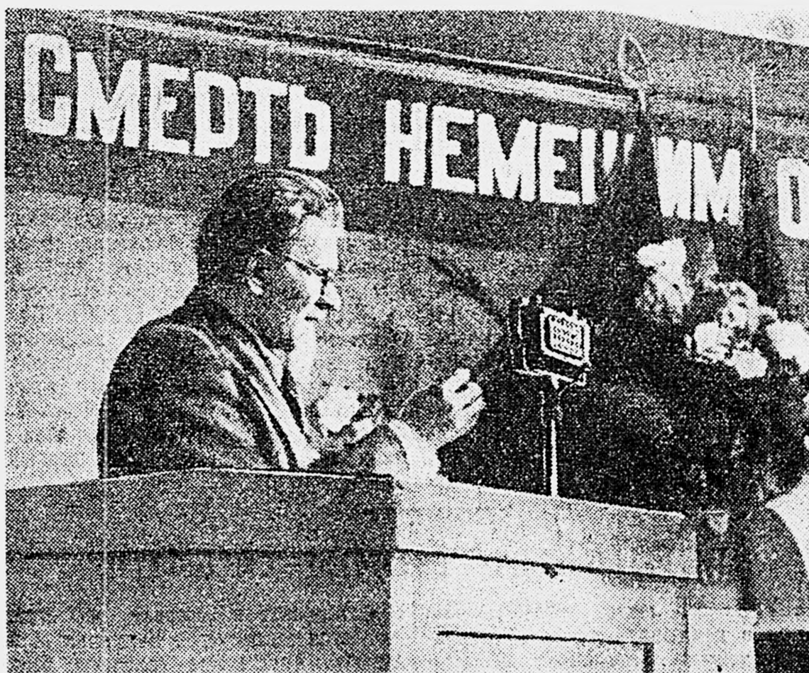
Выступление М. И. Калинина на совещании агитаторов-фронтовиков.