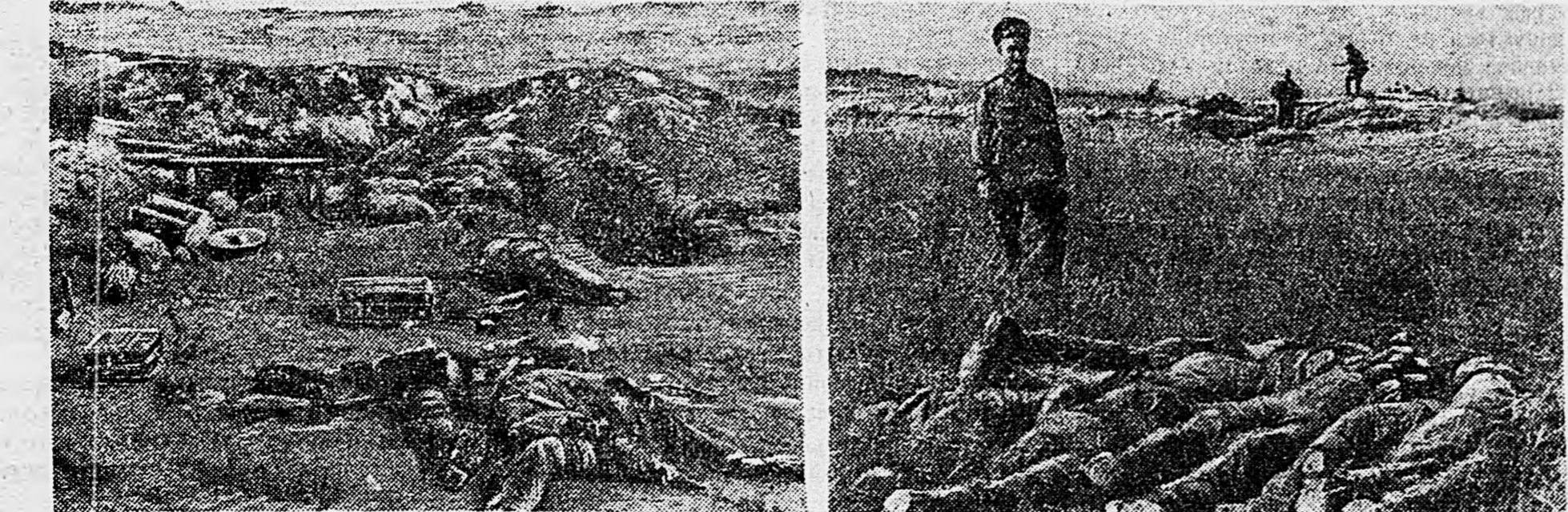
ДЕЙСТВУЮЩАЯ АРМИЯ. Разгромленные нашей артиллерией дзоты и блиндажи противника.

Собрание транспорировалось по радио. (ТАСС).