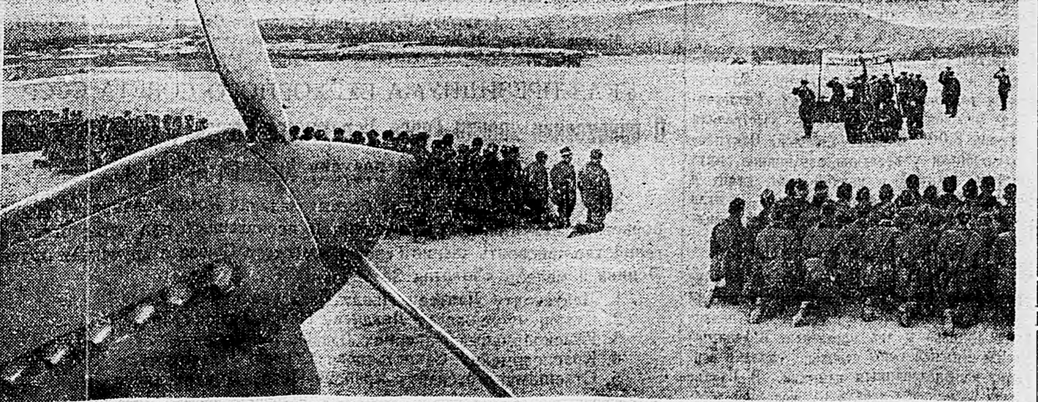
ДЕЙСТВУЮЩАЯ АРМИЯ. Клятва летчиков при вручении Гвардейского знамени 20-му Гвардейскому истребительному полку.