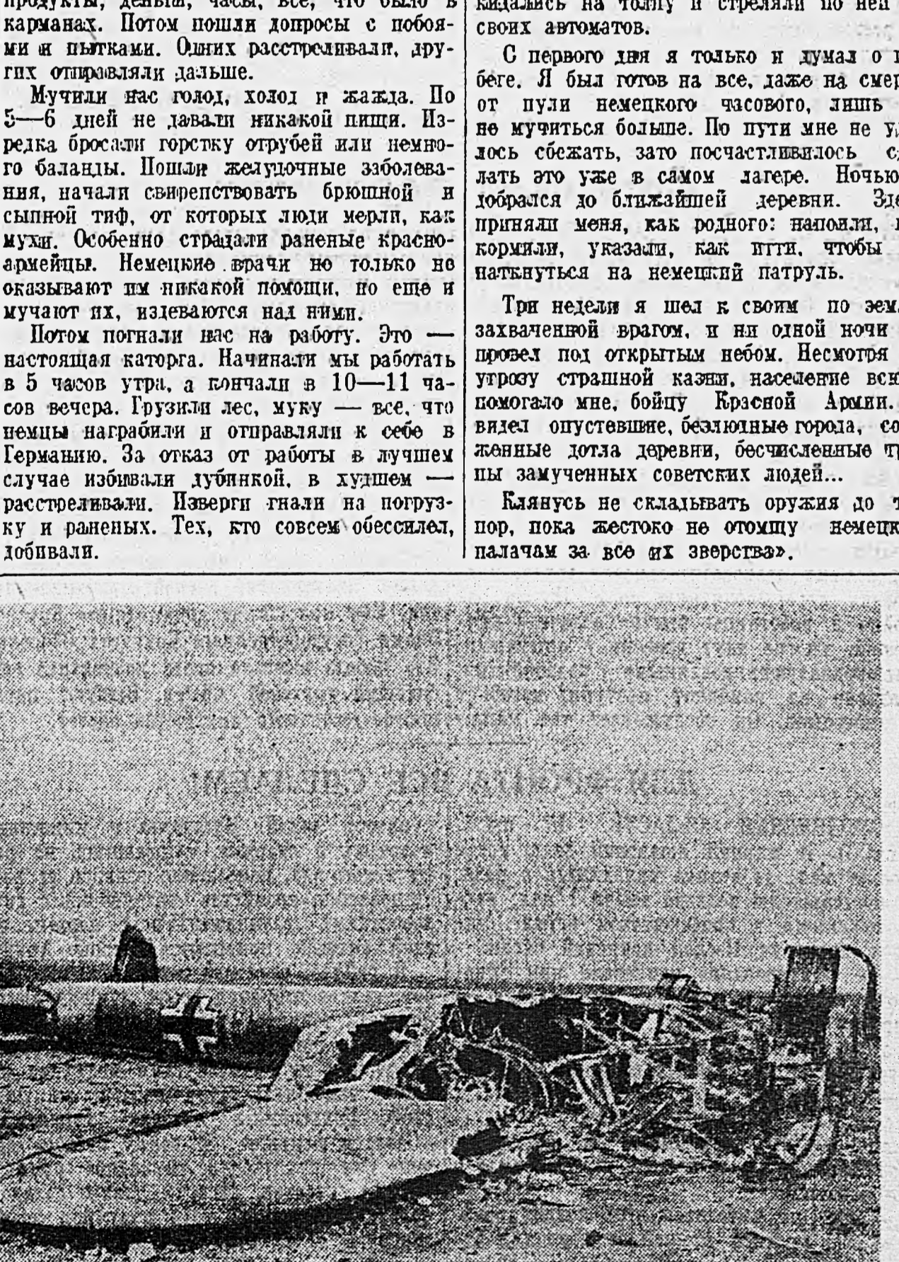
В районе Воронежа. На снимках: 1. Пленные немецкие солдаты. 2. Захваченное трофейное оружие. 3. Сбитый немецкий пикирующий бомбардировщик.