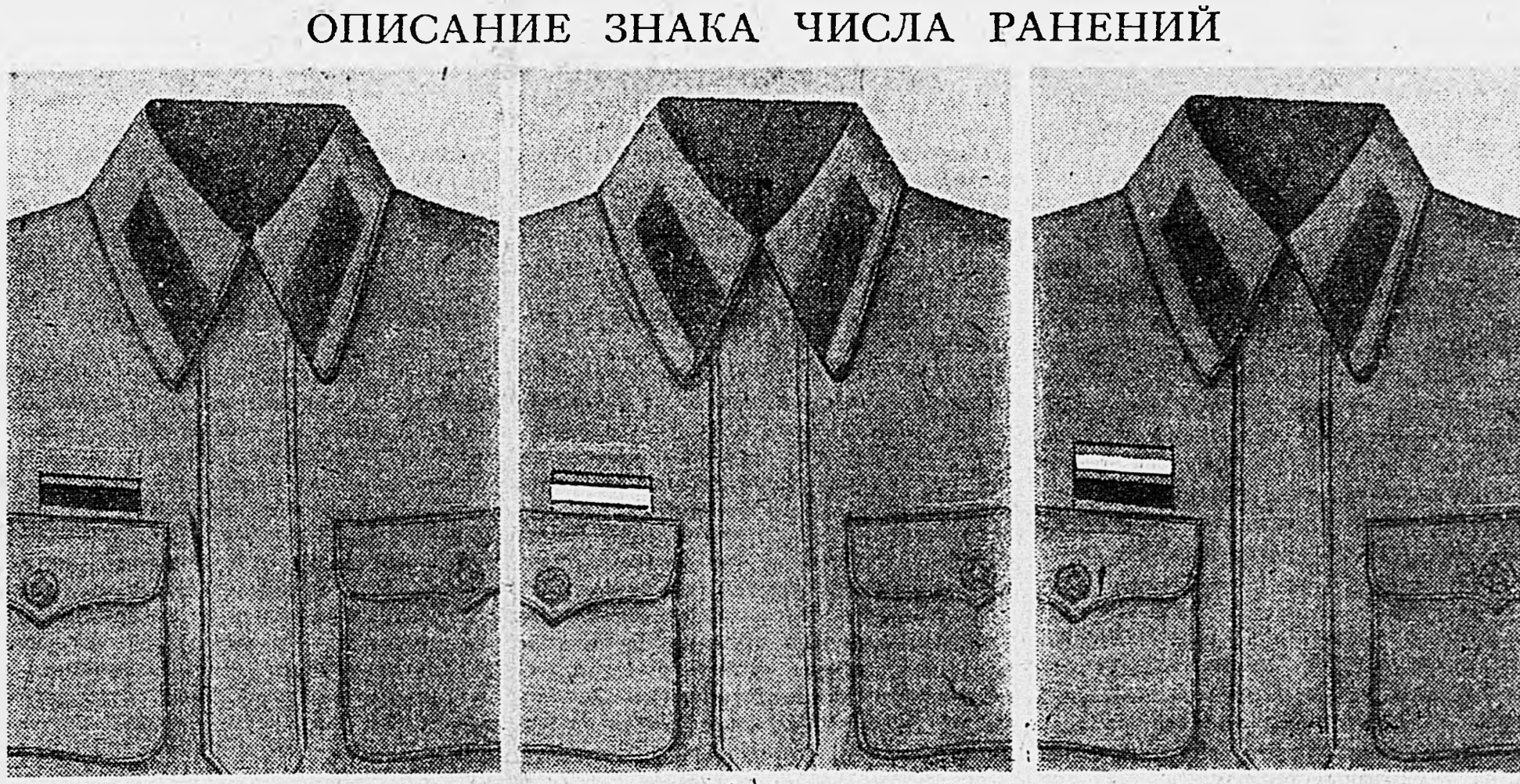
Легкое ранение. Тяжелое ранение. Легкое и тяжелое ранения.

Ночью остановленные контрударами наших частей. Они вынуждены сейчас отказываться от атак, но факты показывают, что противник несколько не отказался от дальнейшего наступления. Он спешно подтягивает танковые части, авиацию, живую силу. Предстоит еще более серьезная и напряженная борьба.