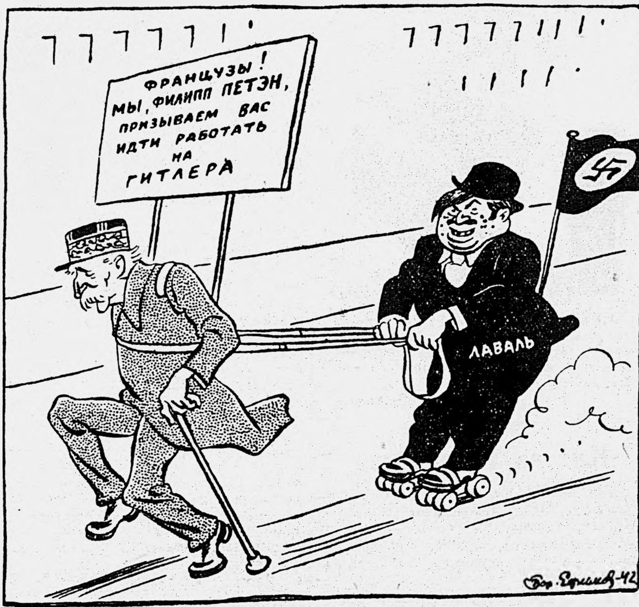
Рекламное турне по Франции