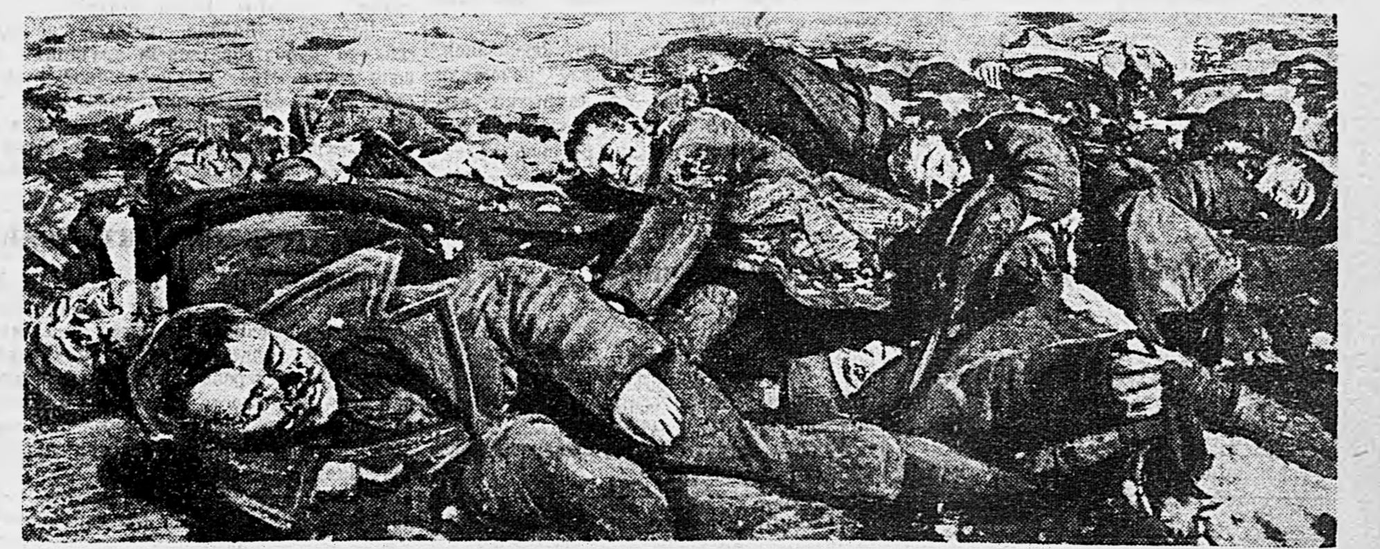
Группа раненых красноармейцев, зверски замученных гитлеровскими палачами.