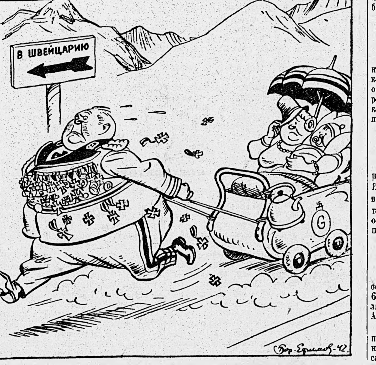
Рис. Бор. Ефимова.

По сообщением иностранной печати, Геринг спешно выезжает со своим семейством в Швейцарию в заблаговременно купленном им поместье.