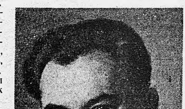
После войны военный корреспондент поглотил...