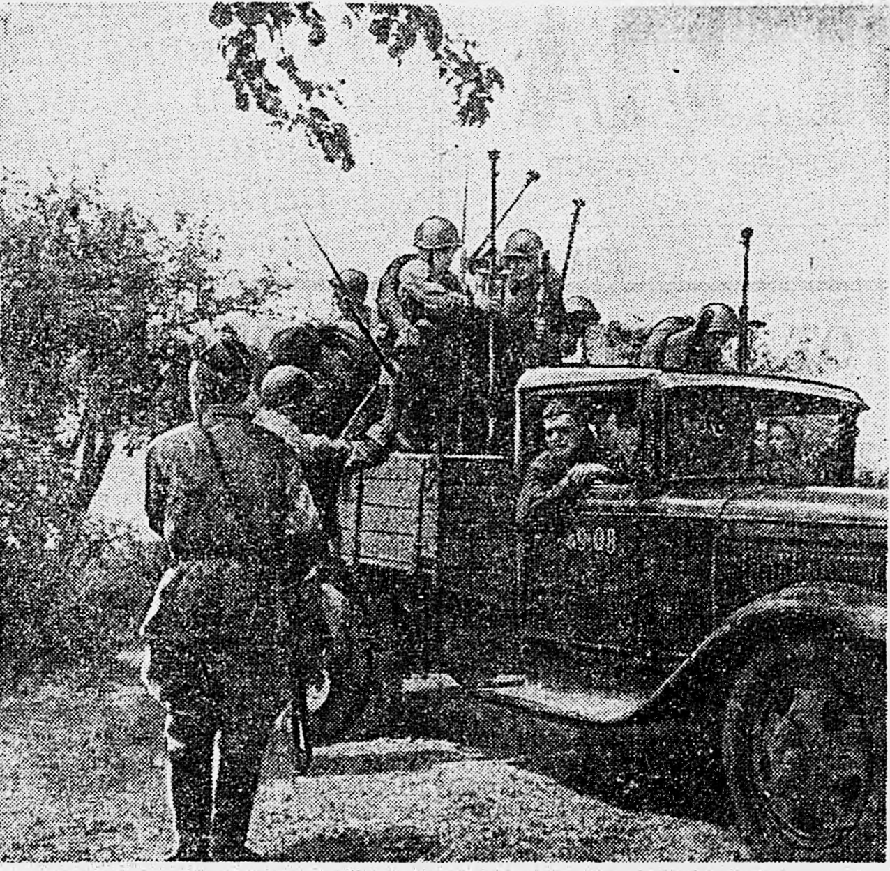
ЮЖНЫЙ ФРОНТ. Переброска подразделения противотанковых ружей на танкоопасный рубеж.