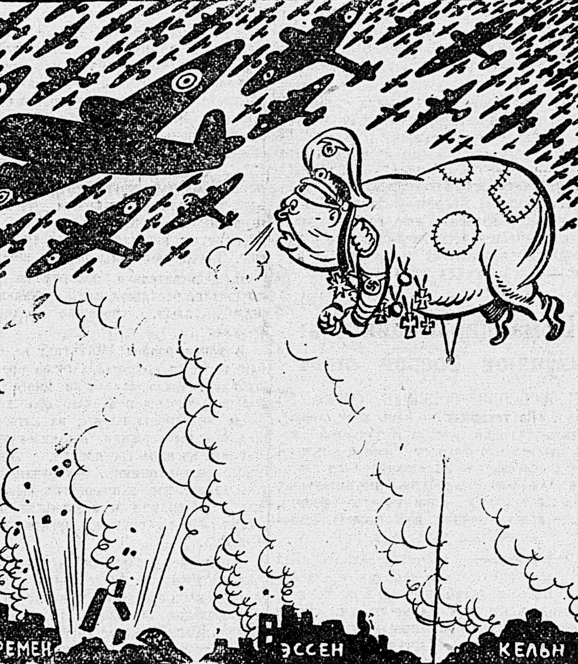
Рис. Бор. ЕФИМОВА. (Из заявления Геринга).

«Я не позволю, чтобы хотя один английский самолет появился над германскими городами».