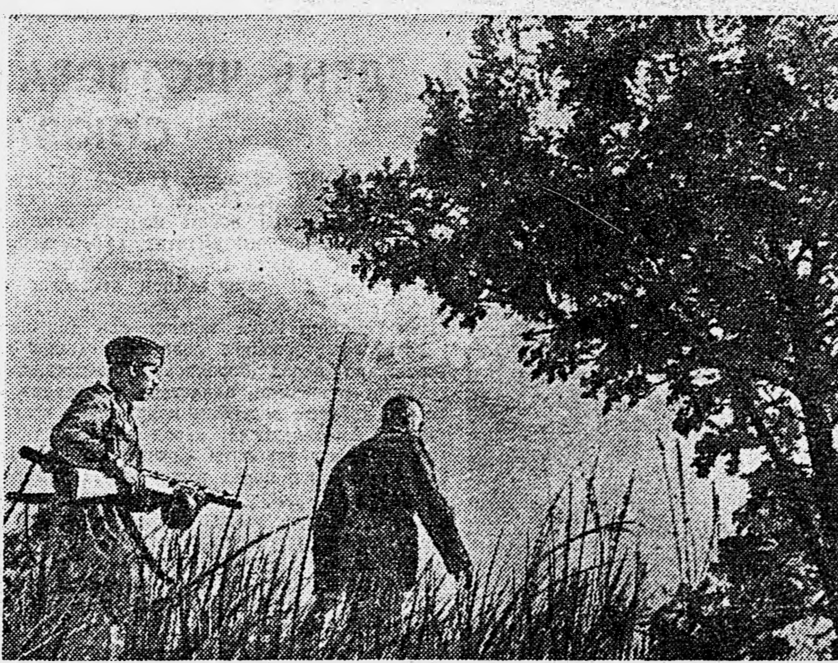
ДЕЙСТВУЮЩАЯ АРМИЯ. Поймал «языка».