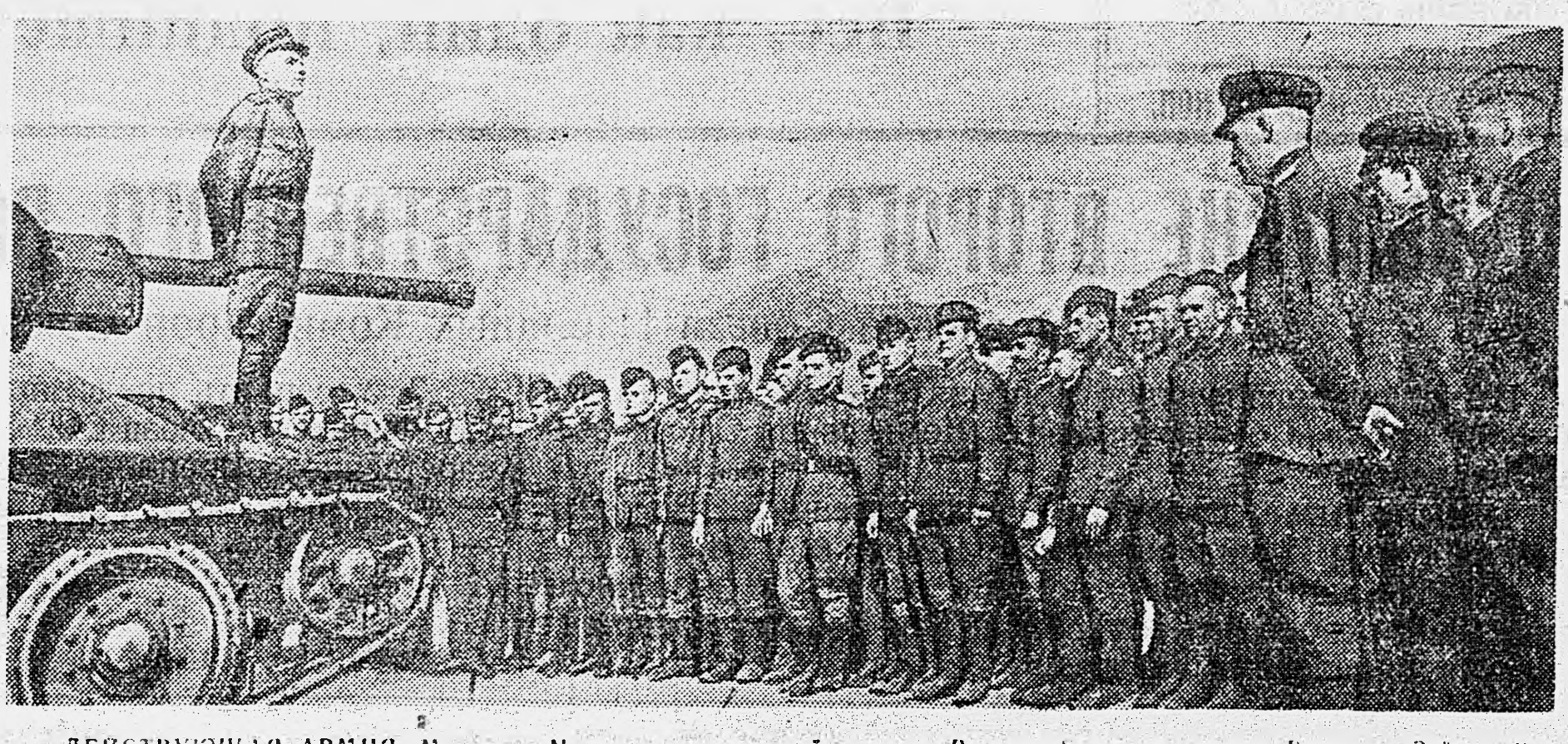
ДЕЙСТВУЮЩАЯ АРМИЯ. Митинг в Н части, посвященный выпуску Второго Государственного Военного Займа.

ДЕЙСТВУЮЩАЯ АРМИЯ. 4 июня. (От наш. корр.). Солнце уже начинало садиться. Его косые лучи скользили по тонким стенам зениток, вытиснувшимся на запад. В этот предвечерний час в штабе узнали по радио, что правительство выпустило Второй Государственный Военный Заем. И командиры, солдаты сразу же разошлись по батареям.