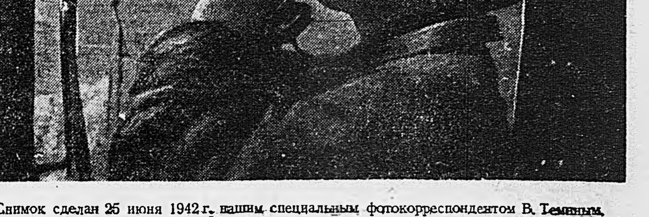
Снимок сделан 25 июня 1942 г. нашим специальным фотокорреспондентом В. Темниным.

Ручей выиз в реку, река выиз в Волгу, Волга знает путь к морю. Любовь к дому, к саду, к краю становится любовью к родине. Разве можно понять силу любви, не проверив ее на страшном огне? Поляны теперь люди, как они любят своих близких, поляны, как любят родину, Россию, Советский Союз. Поляны это до конца, когда враг залез на родину свою низкую руку. Прошлой осенью это не почувствовал самого простого: «Без Родины мне не жить?»