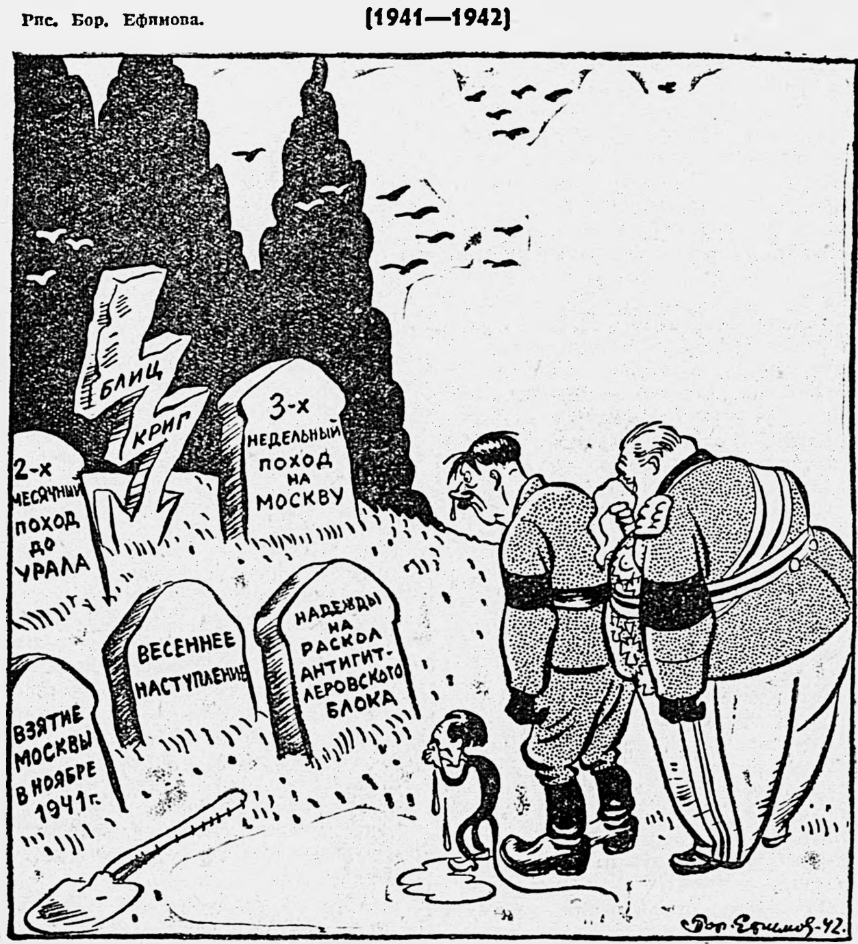
Как мало прожито, как много перебито...