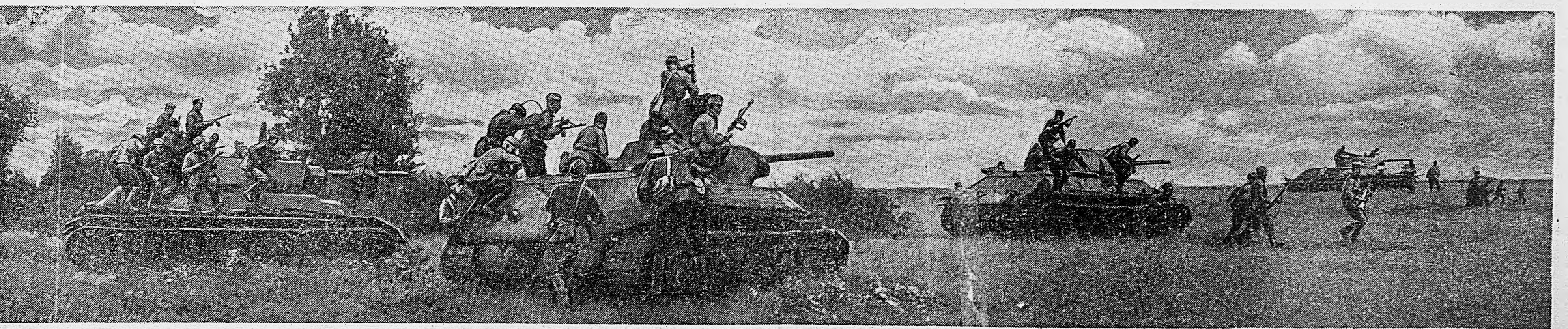
ЮЖНЫЙ ФРОНТ. Танковый десант.