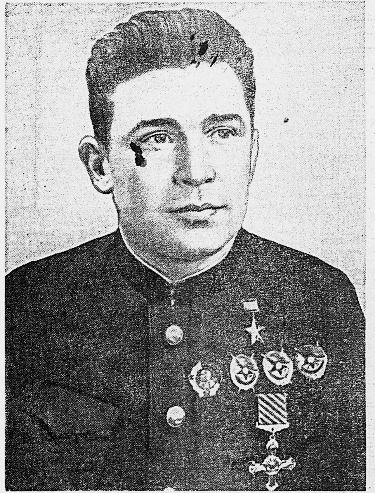
Дважды Герой Советского Союза подполковник Б. Ф. Сафонов.

Указом Президиума Верховного Совета СССР Герой Советского Союза летчик подполковник Б. Ф. Сафонов награжден второй медалью «Золотая Звезда». 19 командирам Военно-Морского Флота присвоено звание Героя Советского Союза. Боевой привет новым Героям — отважным защитникам нашей родины!