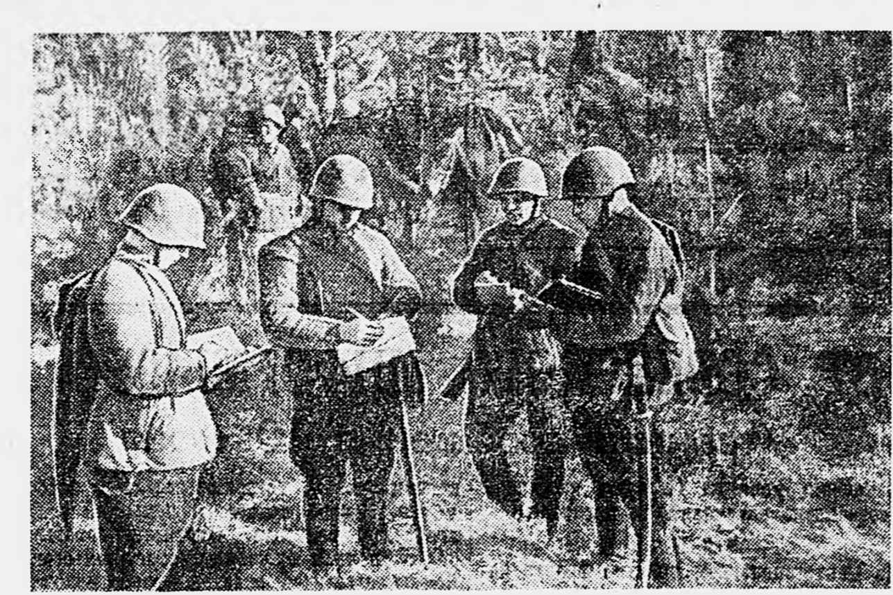
ЛЕНИНГРАДСКИЙ ФРОНТ. Выбор колонного пути.