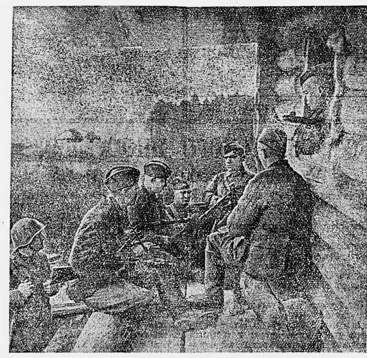
СЕВЕРО-ЗАПАДНЫЙ ФРОНТ. В перерыве между боями. Занятие по изучению восточной автомашины.