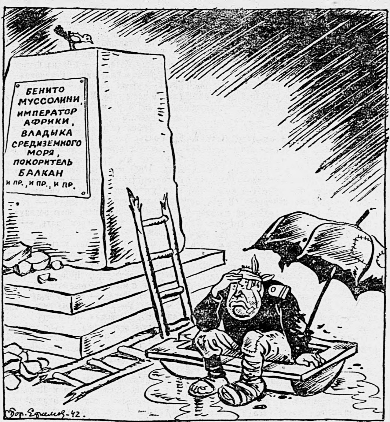
«Душе» у разбитого корыта.