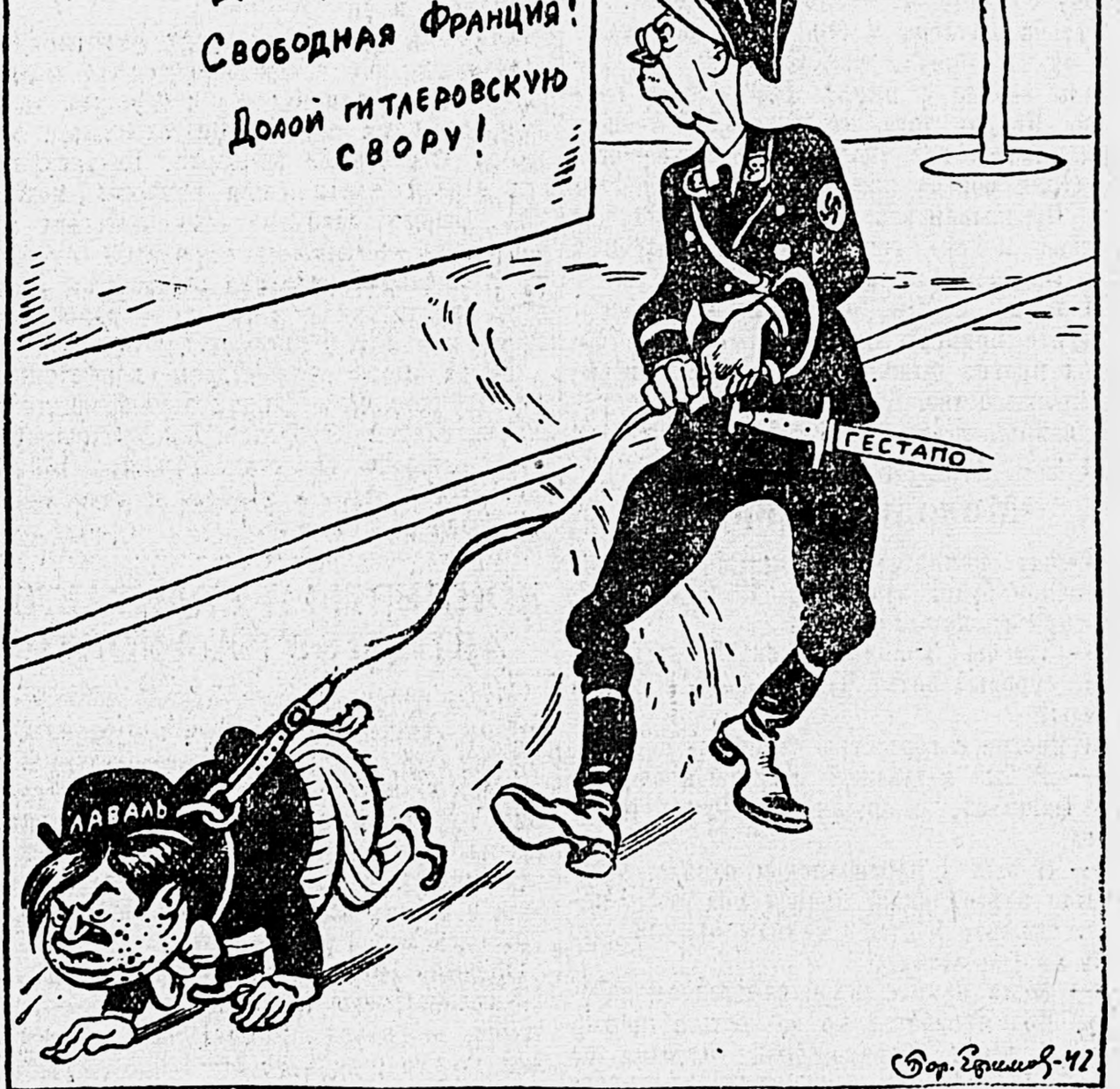
Немецкая ищейка из Виши