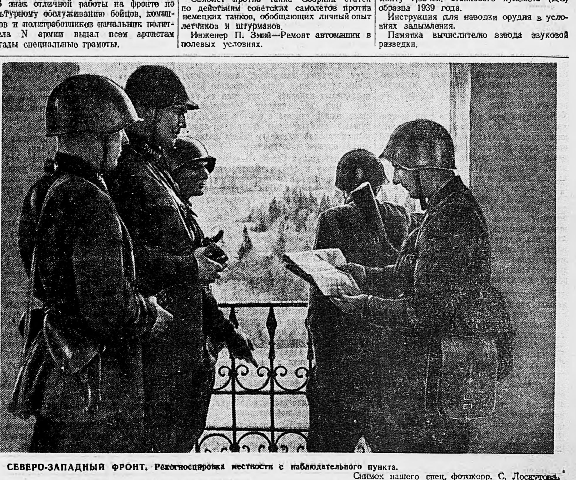
СЕВЕРО-ЗАПАДНЫЙ ФРОНТ. Рекогносцировка местности с наблюдательного пункта. Снимок нашего спец. фотокорр. С. Лоскутова.

Снимок нашего спец. фотокорр. С. Лоскутова.