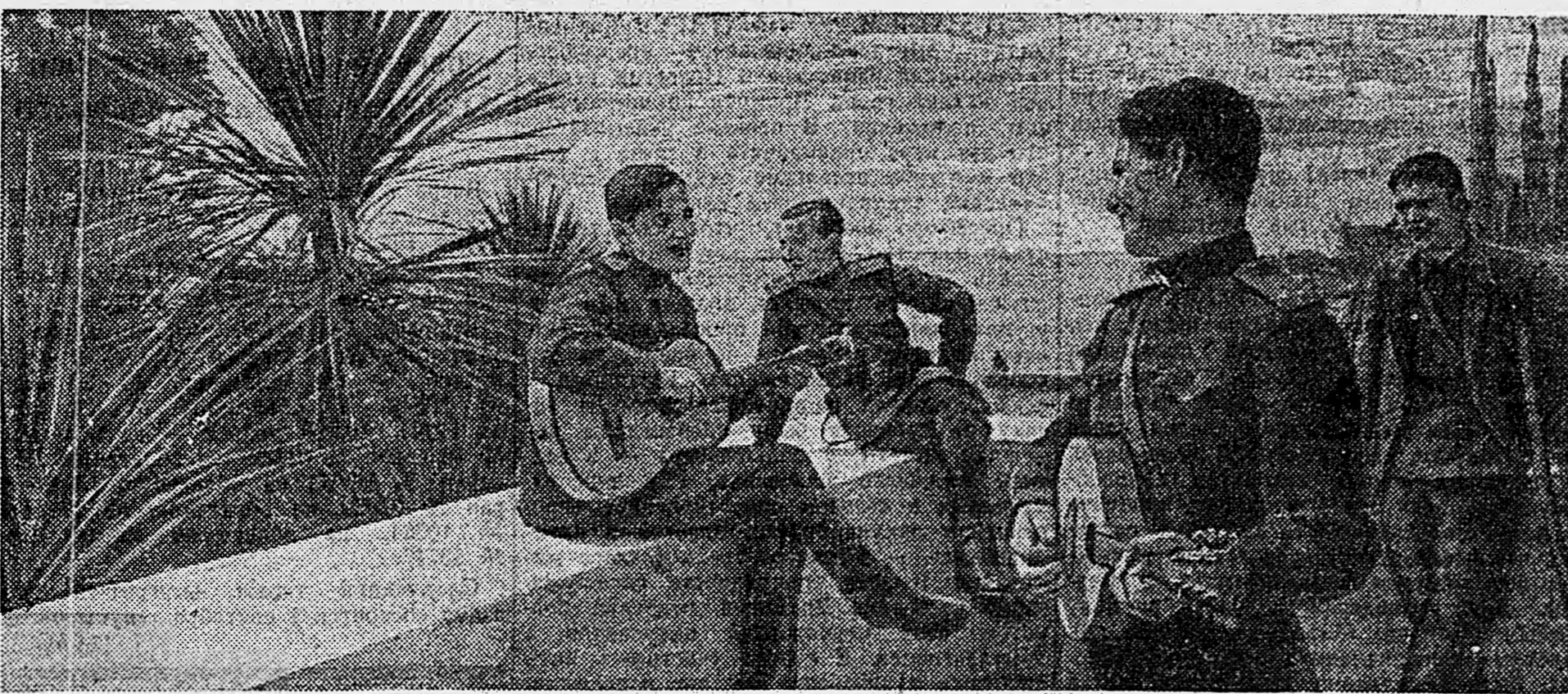
В санатории для раненых участников Отечественной войны на Черноморском побережье.