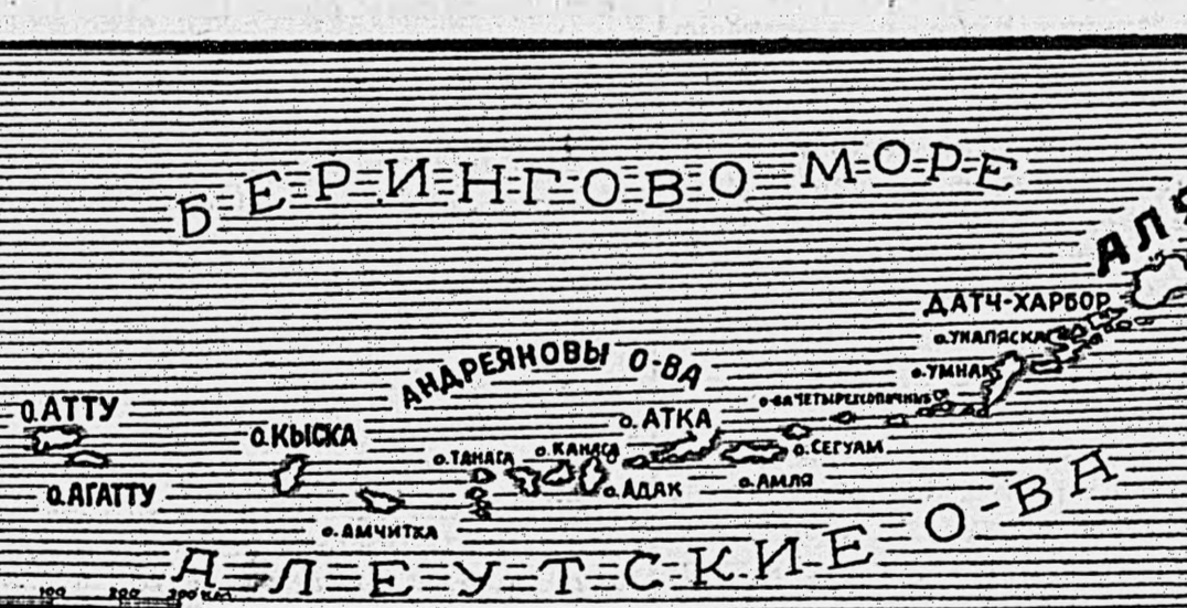
Исследования в районе Алеутских островов не претерпели серьезных изменений. 4 октября морское министерство США сообщило, что американские войска заняли позиции на островах Андреева. Американцы перебазировали на аэродромы этих островов значительные силы своей бомбардировочной и истребительной авиации. Это открыло американцам широкие возможности держать под воздействием своей авиации захваченные японцами базы на островах Атту, Агату и Киска.