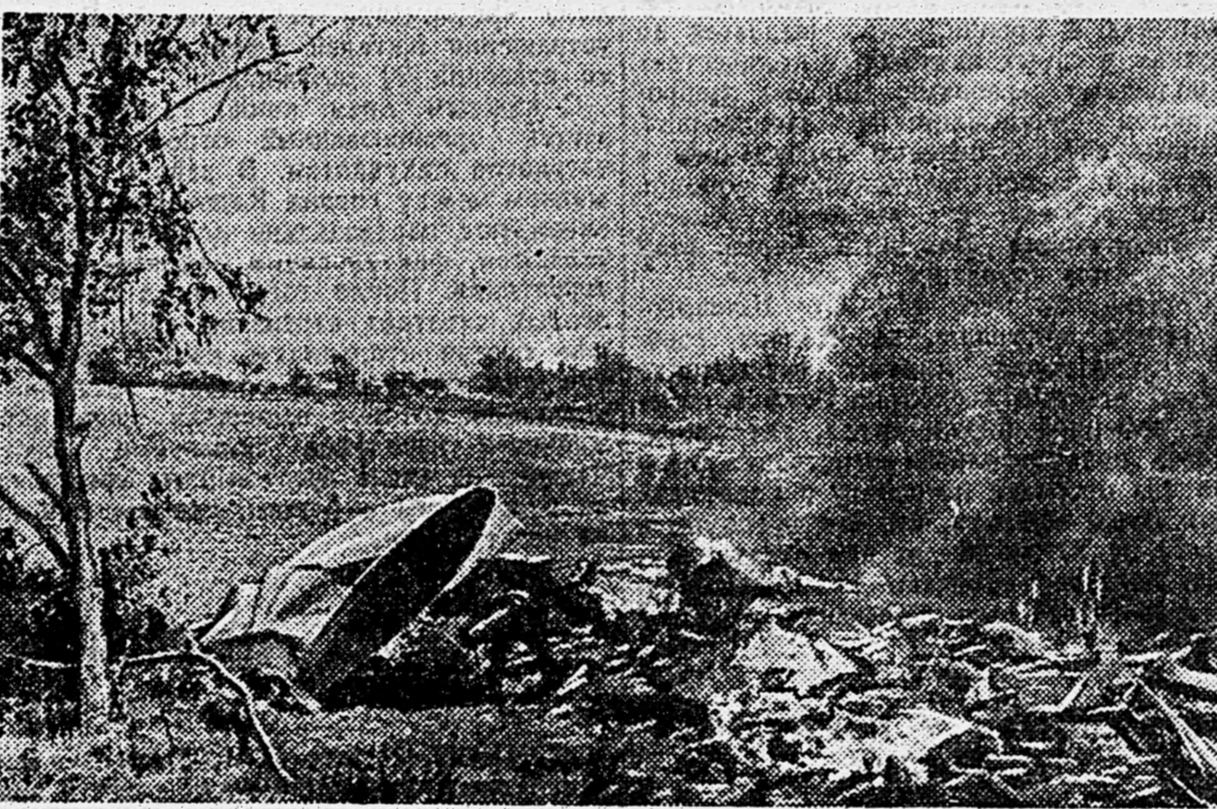
В РАЙОНЕ НОВОРОССИЙСКА. Немецкий самолет, сбитый нашими истребителями.

Свыше 100 членов семей фронтовиков принято на завод, 22 из них работают в цехе крупных деталей. Около 50 подростков детей фронтовиков работают на фрезерных станках, ежедневно выработывая по полторы—две нормы. (ТАСС).