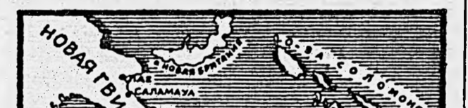
Увеличивая на Гвадалканаре численность своих войск, американцы теснили японские части, постепенно расширяя занятый ими район. В последний период бои на Гвадалканаре развивались под знаком возросшей активности американских войск. В результате неудачно сложившейся для японцев обстановки они были вынуждены к 10 февраля очистить остров, эвакуировав оттуда свои войска.

Необходимость поддержать действия своих наземных войск авиацией и кораблями военно-морского флота, а также переброска на остров подкреплений неизбежно приводили к многочисленным столкновениям на море и в воздухе. Для достижения своих целей противники не считались с потерями кораблей и самолетов. Таким образом на ограниченном участке огромного тихоокеанского театра развернулась своеобразная борьба на истощение морских и воздушных сил сторон. Характерной особенностью морских сражений, происходивших в районе Соломоновых островов, является широкое применение противниками своей авиации. Военные же корабли почти во всех случаях представляли собой в большей степени объекты для нападения авиации противника, чем боевые единицы, ведущие борьбу между собой.