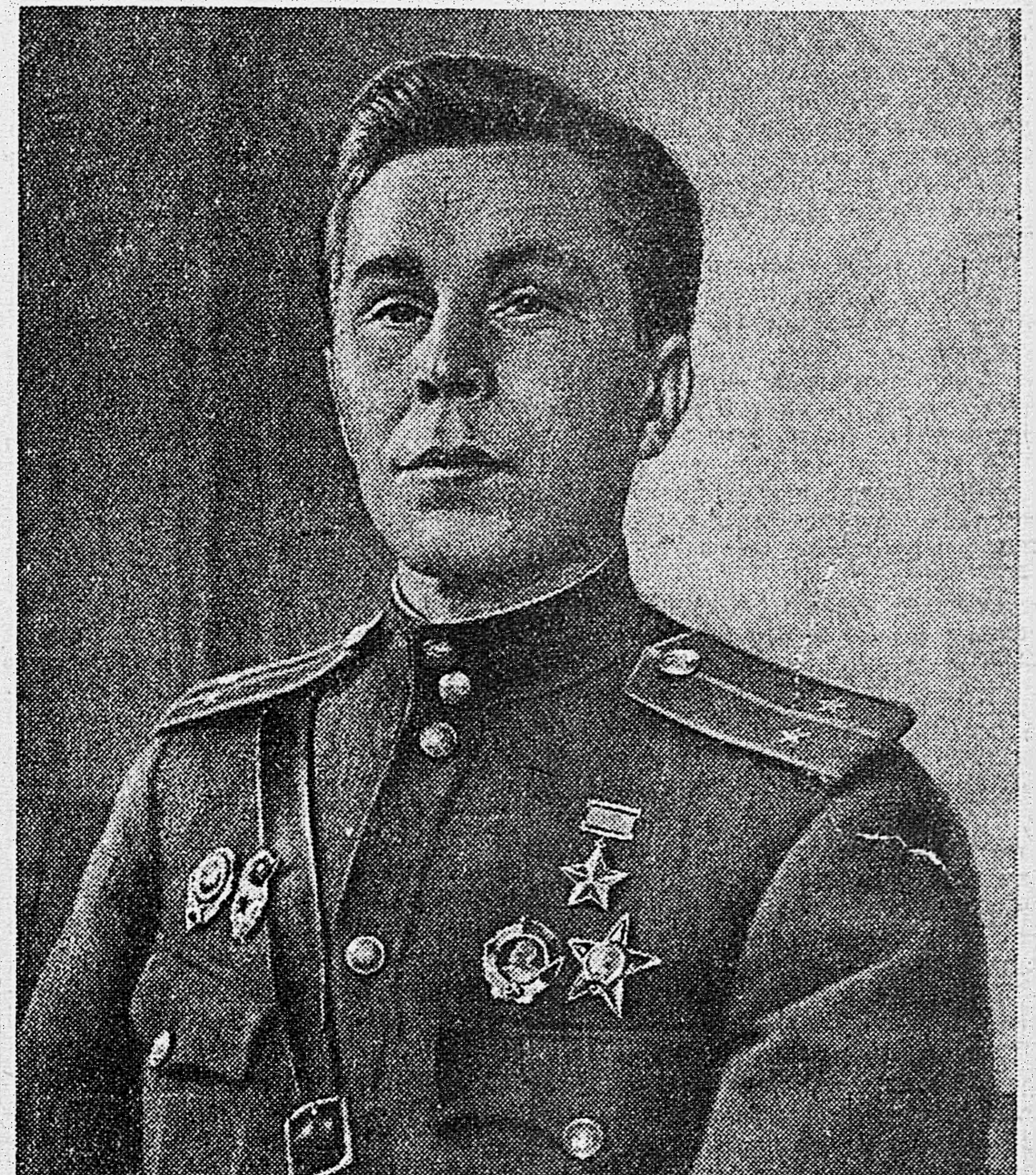
Герой Советского Союза гвардии лейтенант И. П. Гореликов. На днях в Кремле ему была вручена правительственная награда — медаль «Золотая Звезда» и орден Ленина.

Захвативший 22 мая в районе Курска в плен немецкий летчик из 6 отряда 2 группы 1 немецкой эскадры пикирующих бомбардировщиков лейтенант Эрвин Штейнман рассказал: «Наш отряд вылетел с аэродрома в составе 9 самолетов. Одновременно вылетели и другие отряды группы. Перелет был поставлена задача — достигнуть Курска и сбросить бомбы на железнодорожную станцию. В пяти километрах от цели мы были встречены русскими истребителями. Зенитная артиллерия вела сильный огонь. Я беспорядочно сбросил бомбы, не долетев до цели. Настех освободившись от бомб, весь отряд пытался вернуться обратно. Однако удержаться в строю было невозможно, потому что в воздухе господствовали русские истребители. Я видел, как один за другим упали на землю самолеты моего отряда. Мне удалось продержаться дольше всех. Русский истребитель пробил радиатор в моей машине, и я тоже был вынужден сесть. Здесь, в плену, я встретил летчиков пяти экипажей своего отряда».