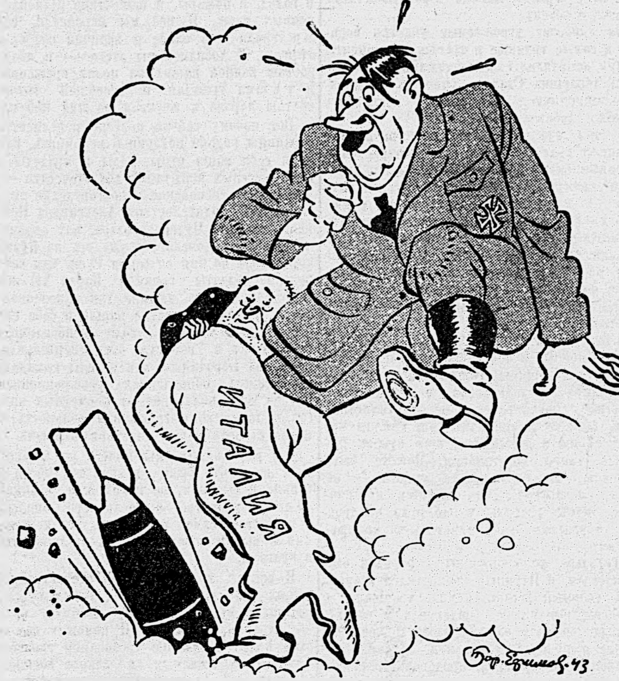
На чувствительную мозоль...