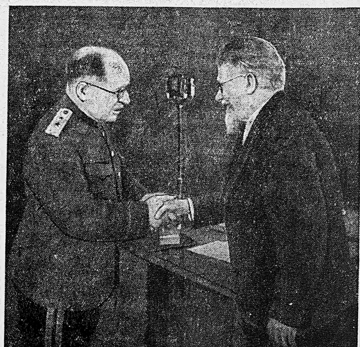
Председатель Президиума Верховного Совета СССР М. И. Калинин поздравляет Героя Социалистического Труда генерал-лейтенанта медицинской службы Н. Н. Бурденко с получением высокой награды.