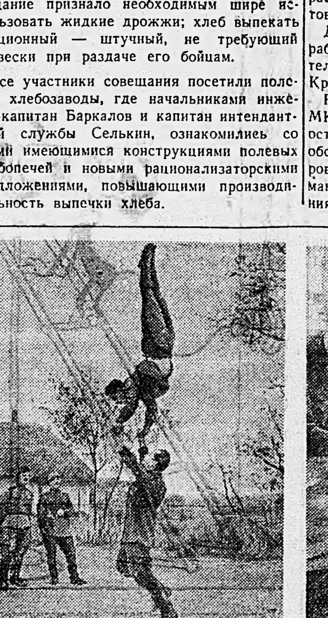
Герой Советского Союза подполковник И. Летуний. 1. На рассвете, вернувшись после выполнения боевого задания, летчики отдыхают. 2. Спорт — любимое занятие воздушных бойцов в свободные часы. 3. Вечер. Скоро в путь. Летчики изучают район предстоящих действий. 4. Самолет готов. Под покровом ночи легкий бомбардировщик стартует на выполнение боевого задания.