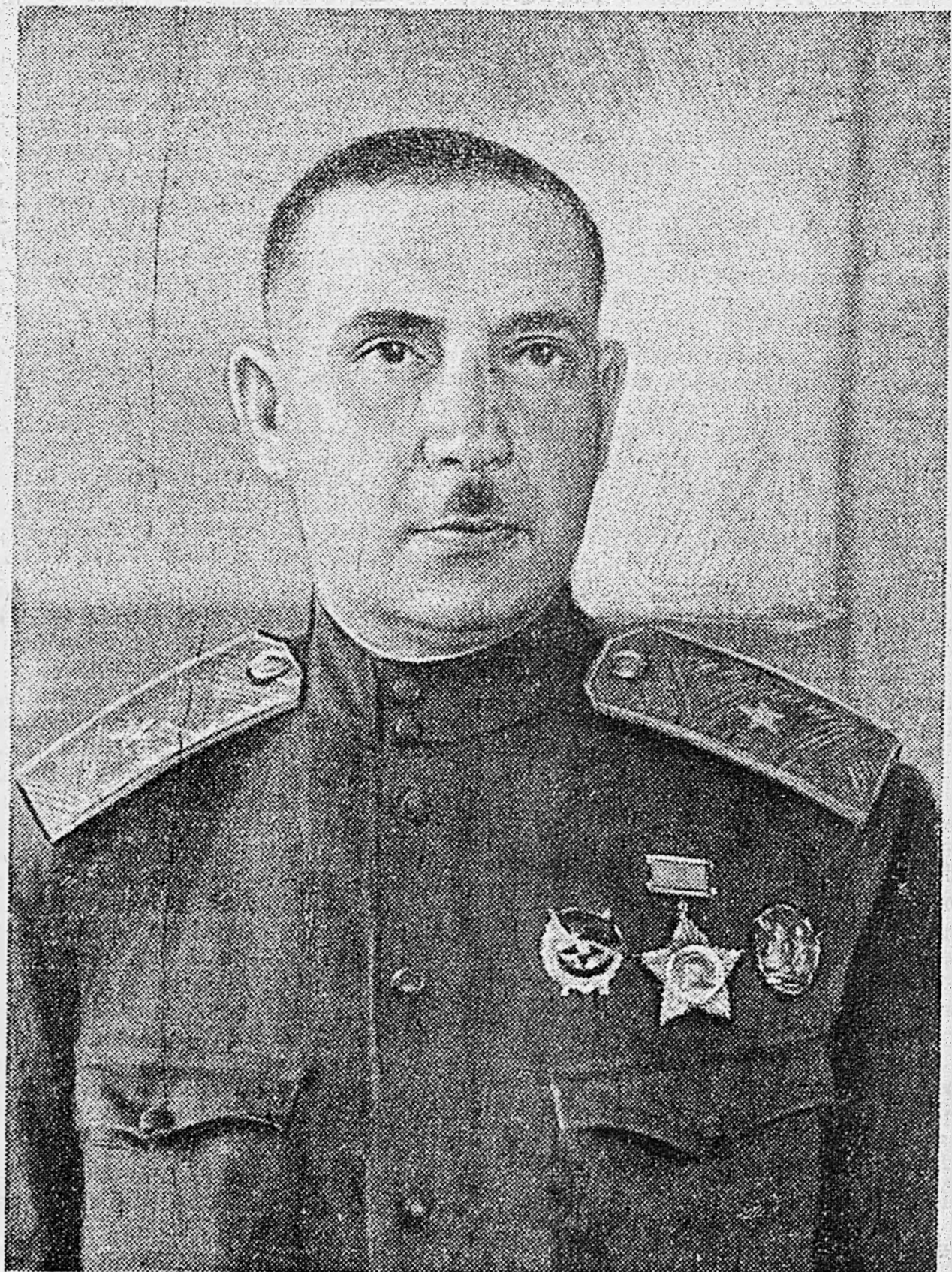
Генерал-майор артиллерии Ю. М. Федоров, получивший на днях в Кремле правительственную награду — орден Суворова II степени.

Указ Президиума Верховного Совета СССР (2 стр.). Гвардии полковник М. Бойко. — Учеба на опыте войны (3 стр.). Майор Н. Прокофьев. — Маневр зенитных батарей (3 стр.). Юрий Либединский. — Живой Сталинград (4 стр.). Выступление Черчилля в Вашингтоне (4 стр.). Заявление Рузвельта (4 стр.). Война на Тихом океане (4 стр.).