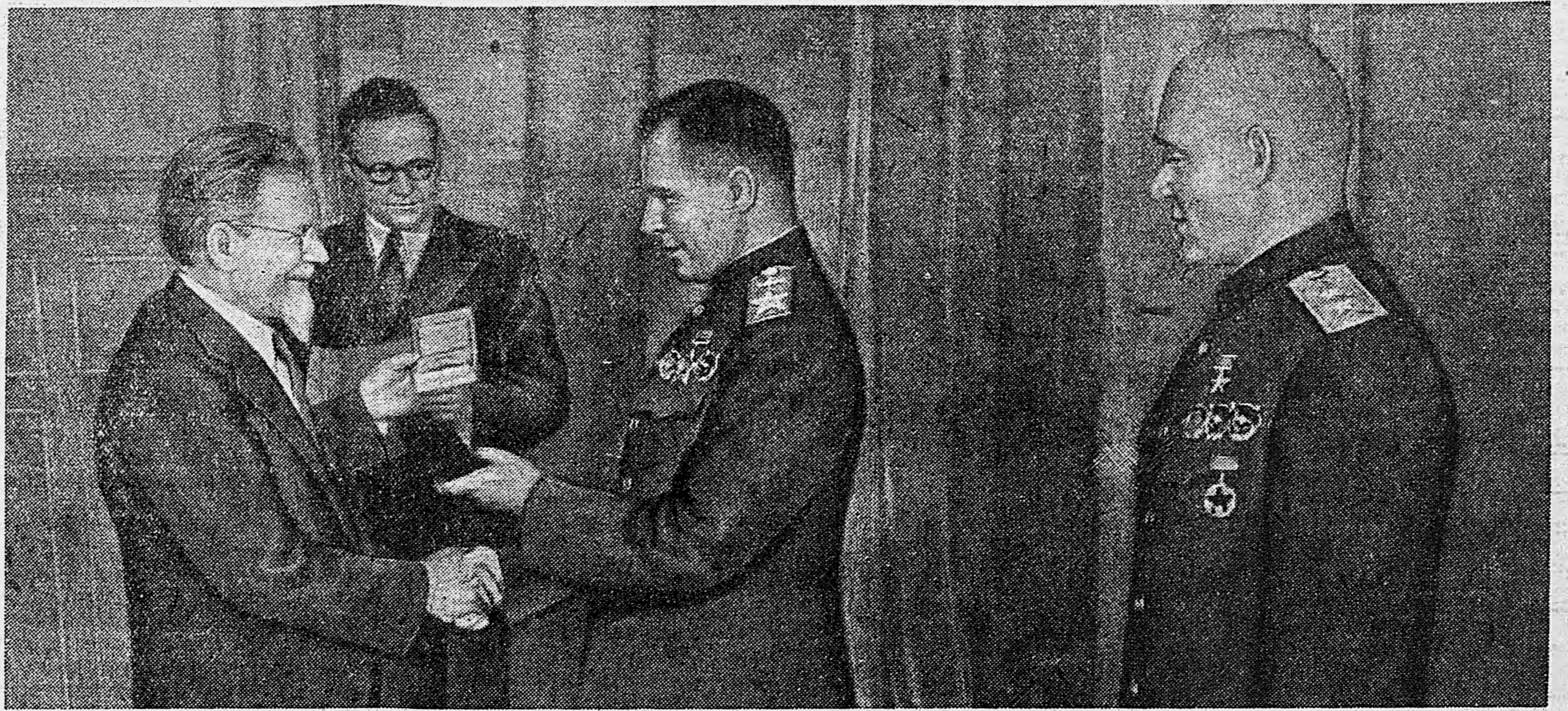
Вчера в Кремле состоялось вручение правительственных наград. На снимке: Председатель Президиума Верховного Совета СССР М. И. Калинин вручает маршалу авиации А. А. Новикову Маршалский Знак Звезды. Справа — генерал-лейтенант Д. Д. Лелюшенко, получивший орден Суворова I степени. В центре — секретарь Президиума Верховного Совета СССР А. Ф. Горкин.

Авианаводчик — не сторонний наблюдатель, бесстрастно регистрирующий факты, а непосредственный участник воздушного сражения. Постоянно тренируясь и совершенствуясь, каждый авианаводчик может и должен быть верным и деятельным помощником наших летчиков в их борьбе за уничтожение врага в воздухе.