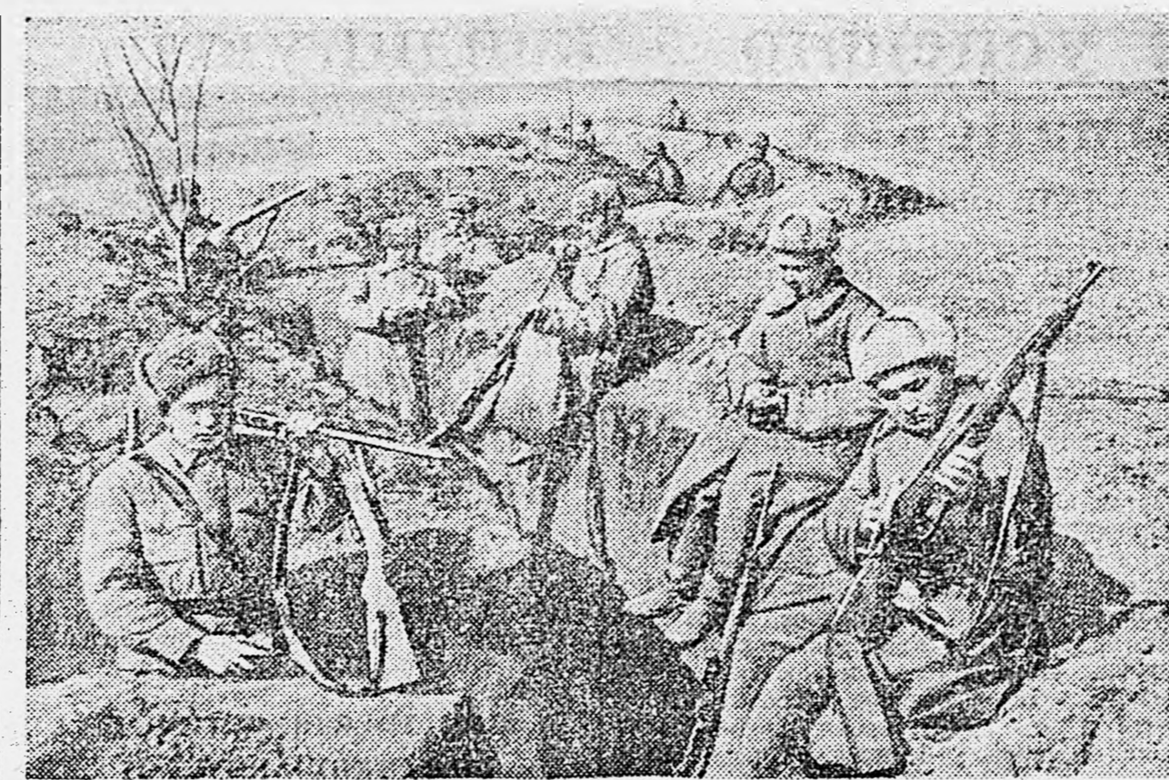
ДЕЙСТВУЮЩАЯ АРМИЯ. Бойцы части майора Горювского в перерыве между боями чистят оружие.