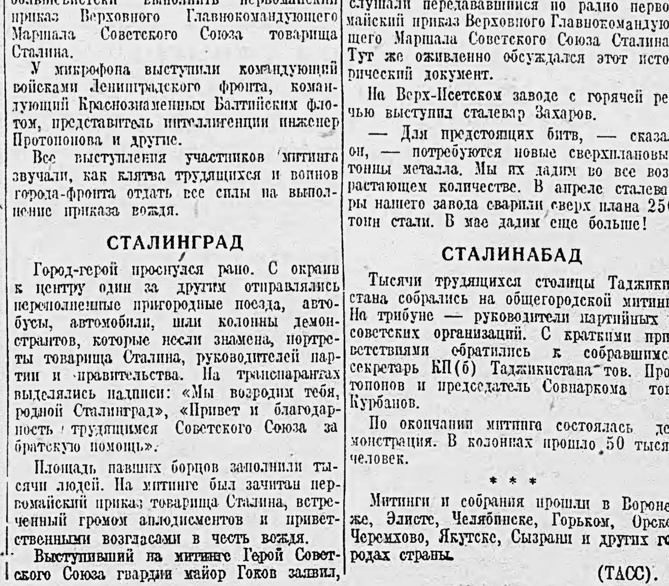
Тысячи трудящихся Сталина Таджикистана собрались на общегородской митинг. На трибуне — руководители партийных и советских организаций. С краткими приветственными обращениями к собравшимся секретарь КП(б) Таджикистана тов. Протопопов и председатель Совнаркома тов. Курбанов. По окончании митинга состоялась демонстрация. В колоннах прошло 50 тысяч человек. *** Митинги и собрания проишли в Воронеж, Элисте, Челябинске, Горьком, Орле, Черемхово, Якутске, Сызрани и других городах страны. (ТАСС).