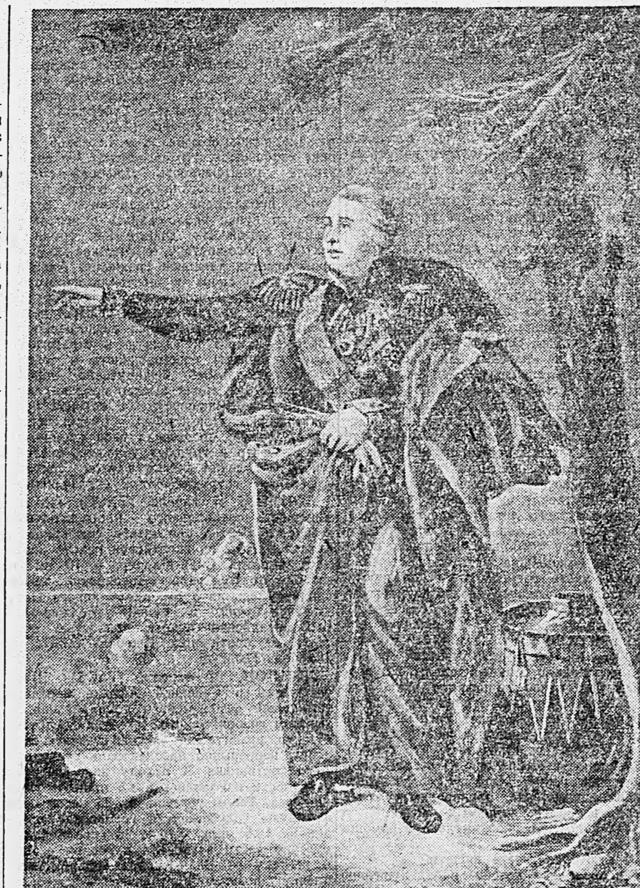
Фельдмаршал Михаил Илларионович Голенищев-Кутузов.