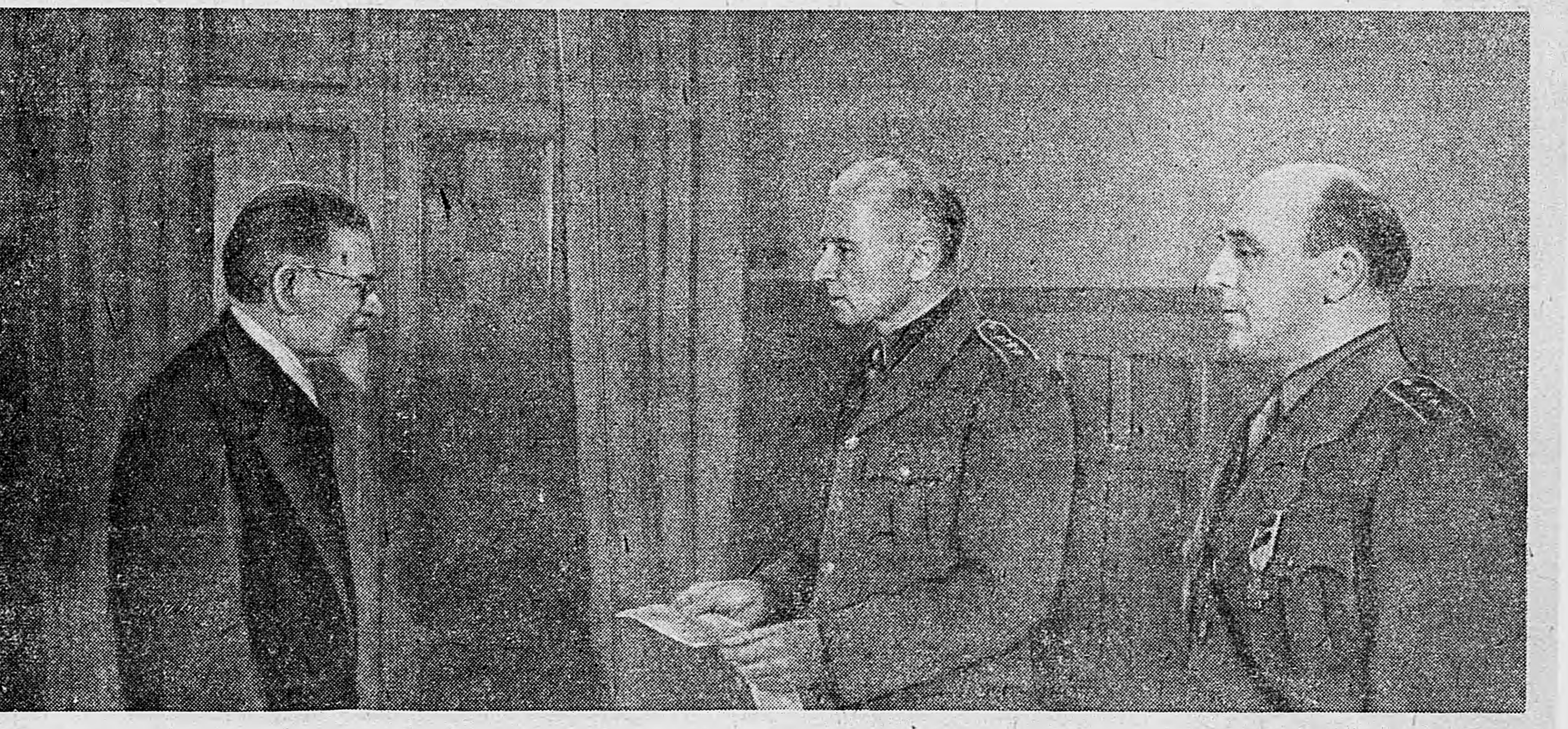
Вчера в Кремле состоялась вручение правительственных наград. На снимке: Председатель Президиума Верховного Совета СССР М. И. Калинин вручает орден Ленина командиру Чехословацкой воинской части полковнику Л. И. Свободе; справа — начальник Чехословацкой военной миссии в СССР полковник Г. И. Пика.