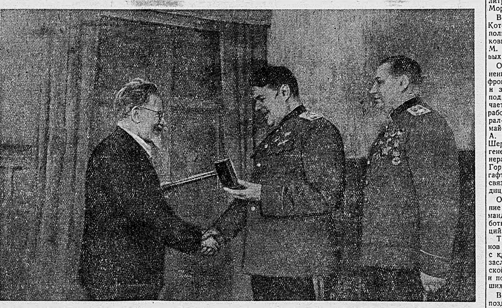
ВЧЕРА В КРЕМЛЕ. Вручение Председателем Президиума Верховного Совета СССР М. И. Калининым маршальского знака отличия — «Маршальской Звезды» маршалу Советского Союза А. М. Василевскому и маршалу артиллерии Н. Н. Воронову.

ОБЯЗАТЕЛЬСТВА ВЫПОЛНЯЮТСЯ С ЧЕСТЬЮ ЧКАЛОВ, 20 апреля. (ТАСС). Коллектив Южноуральского никелевого комбината переживает большой подъем. В ходе предмайского соревнования он принял повышенное обязательство — увеличить производительность труда в полтора раза. Впереди идет плавильный цех, работающий сейчас на небывало высоких скоростях. Давление в 750 миллиметров до сих пор считалось предельным. Плавильщики довели его до 1000 миллиметров. Перевыполнение суточного задания на 15—17 процентов стало повседневным.