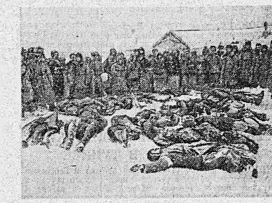
Трудно представить себе более разительный пример человеческой жестокости фашистских детоубийц.

Мы знаем тысячи преступлений, совершенных немцами на нашей земле, и полны жадной мести за муки и горе советских людей. Но каждое новое злодеяние, о котором мы узнаем, еще одной жгучей каплей переполняет чашу нашего праведного гнева. Взгляните на эти снимки: вот с кем воюют солдаты Гитлера, вот чьей кровью забрызганы разбитые знамена немецких полков!