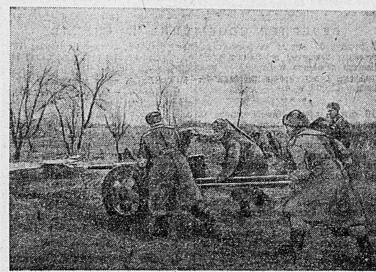
НА КУБАНИ. Противотанковое орудие выдвигается на новый огневой рубеж.

В ответ на указ Президиума Верховного Совета железнодорожники станции Москва-Пассажирская, Ярославской дороги, взяли в предельном совершенстве дополнительные обязательства. (ТАСС.)