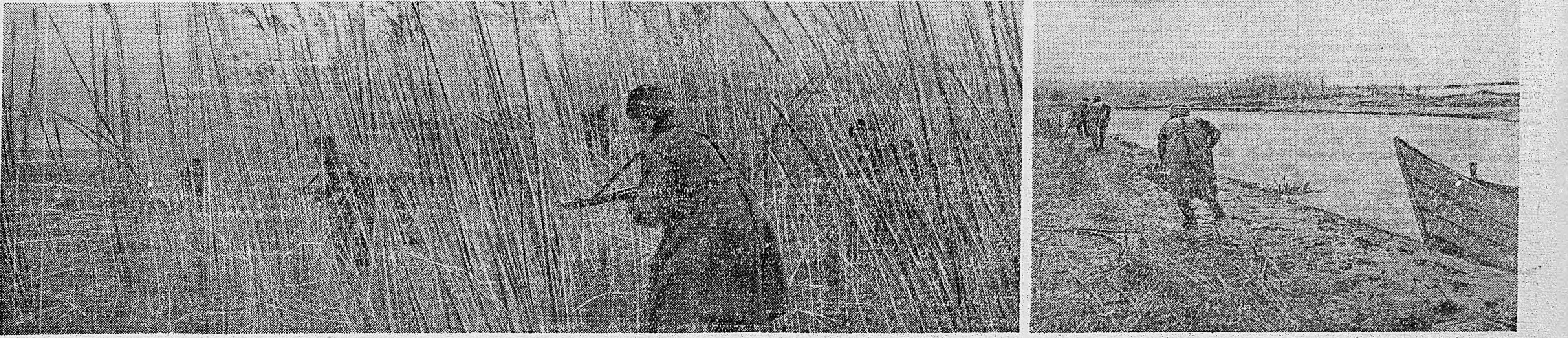
НА КУБАНИ. Автоматчики продвигаются на новый рубеж.

В ходе одного из налетов два наших истребителя встретились с двумя «Фокке-Вульф-190» и выжили их бой. Немцы не выдержали атаки советских истребителей и срывались, оставив без охраны в воздухе железнодорожную станцию. Наши истребители, сопроводившие истребителей, беспощадно атаковали воинский эшелон немцев, причем разбили несколько вагонов и продовольственный склад.