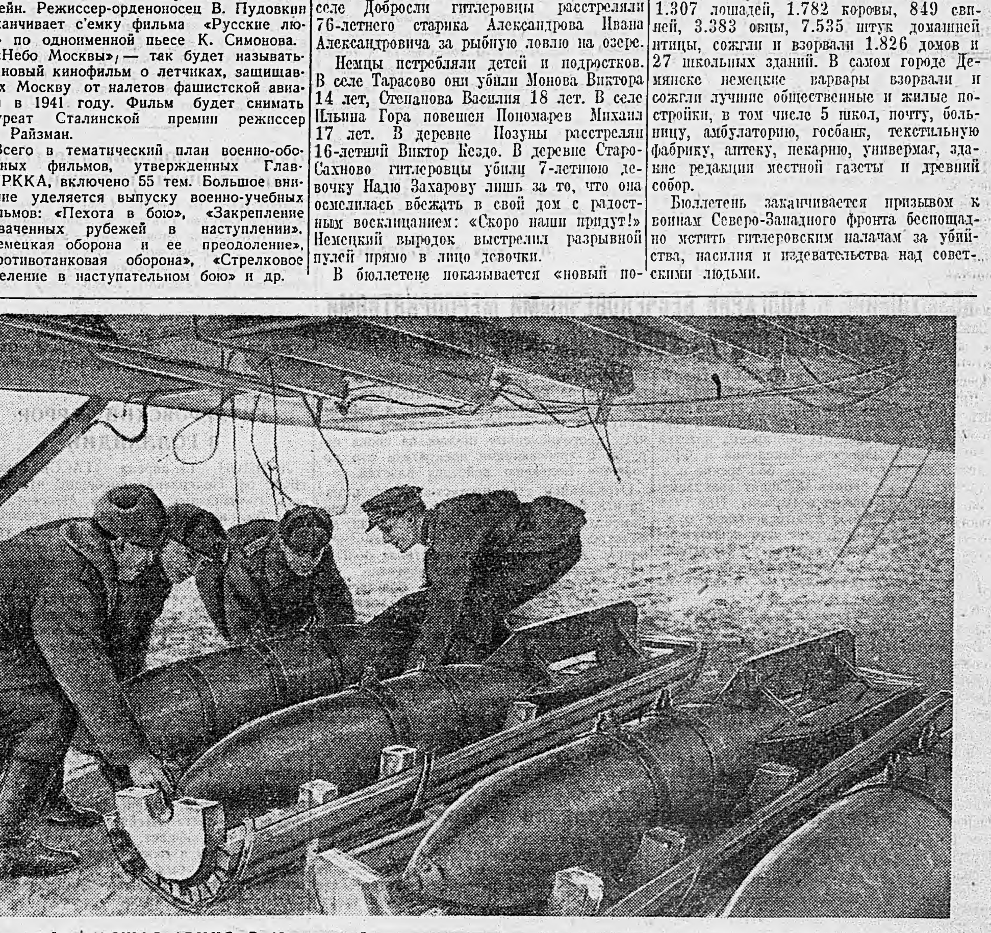
ДЕЙСТВУЮЩАЯ АРМИЯ. В 12-м гвардейском авиационном полку дальнего действия. Подосека боев летчиком.